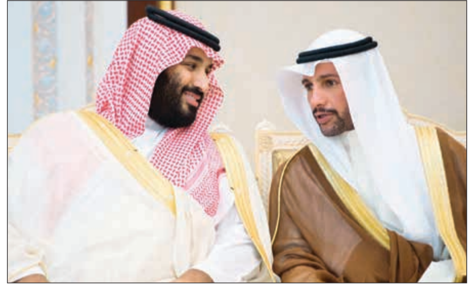
صاحب السمو الملكي الأمير محمد بن سلمان ولي العهد السعودي خلال حديثه مع رئيس مجلس الأمة مرزوق الغانم امس (واس)

جانب رجال الأمن القائمين على تنظيم حركة الحج، وعلى مداره ومخارجه، واتسمت حركة الحج نحو جسر الجمرات والساحات المحيطة به، وفق الوكالة، بتدفق متدرج وآمن على دفعات، وتوزعت على الأدوار حسب التنظيم المعد، ثم العودة إلى مواقع إقامتهم بانسيابية ومروية، فيما اتسمت الطرق في مشعر «منى» إجمالاً بالروية في الحركة المرورية للسيارات وتنقل الحجاج. وبعد أن فرغ الحجاج من رمي جمرة العقبة بدأوا بنحر هديهم (لحاج المتمتع والمقرن فقط)، ثم حلق الرؤوس، وبعدها الطواف بالبيت العتيق، والسعي بين الصفا والمروة.