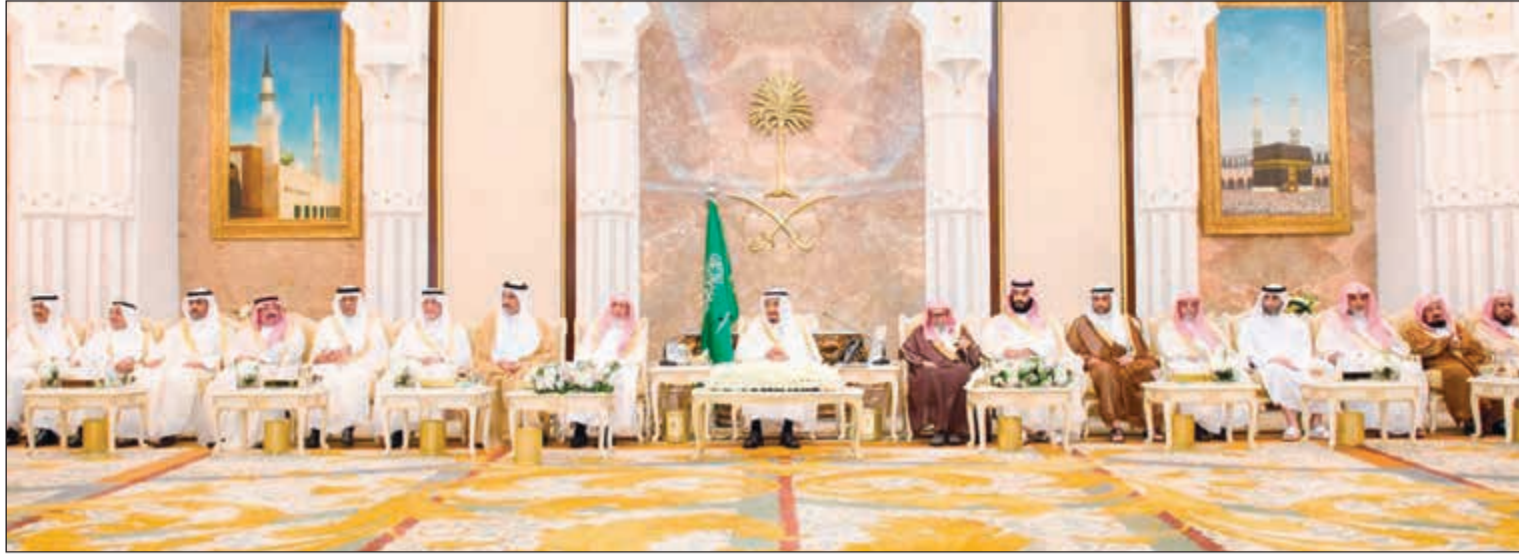
خادم الحرمين الشريفين يستقبل أصحاب السمو الأمراء ومفتي عام المملكة وكبار المدعوين من دول مجلس التعاون الخليجي

خادم الحرمين الشريفين تفقد راحة ضيوف الرحمن في مشعر منى وأكد أن المملكة لن تتوانى أبداً عن حماية أمنها وصون استقرارها وحفظ مصالحها