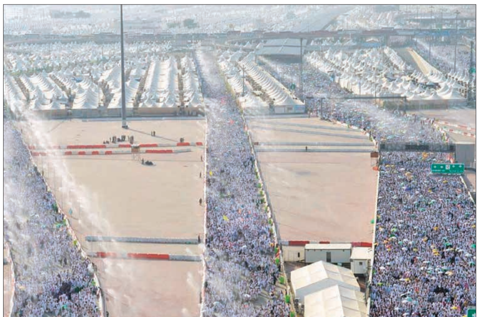
منى تستقبل ضيوف الرحمن مهلبين مكبرين لرمي جمرة العقبة امس

منى - واس: أكد المتحدث الأمني بوزارة الداخلية السعودية اللواء منصور التركي، نجاح خطط يوم عرفة والنفرة إلى مزدلفة وصولاً إلى تصعيد جموع الحجاج إلى مشعر منى والبدء في رمي جمرة العقبة وأداء طواف الإفاضة، مشيراً إلى أن الجهات المعنية بشؤون الحج تتابع مراحل تنقلات جموع الحجاج وما يقدم لهم من