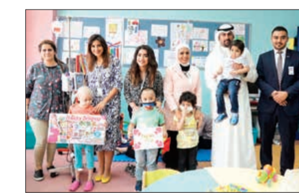
لقطة جماعية خلال زيارة الوطني لمستشفى بنك الكويت الوطني