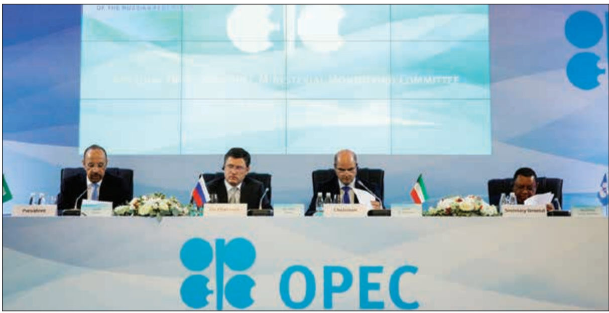
أوبك تجاملت لسنوات طويلة خطر ثورة النفط الصخري

وكالات: أعطى أسوأ إعصار ضرب الولايات المتحدة الأميركية خلال 50 عاما إشارات متضاربة إلى منظمة الدول المصدرة للنفط أوبك لدعم أسعار النفط بعد تعطل 15٪ من إنتاج أميركا النفطية في خليج المكسيك. وحتى الآن بعد تأخير الإعصار هارفي على أسواق النفط العالمية أحد أغرب الأمور التي شهدتها مسؤولو أوبك على مدى العقود الماضية، بعد أن أثر العاصفة على بعض أكبر التعليلات في البنية التحتية للطاقة في الولايات المتحدة لكنها تعجز حتى الآن عن دعم أسعار الخام.