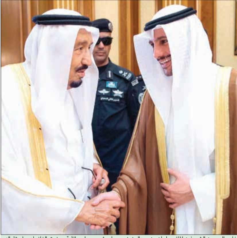
خادم الحرمين الشريفين الملك سلمان بن عبدالعزيز مرحبا برئيس مجلس الأمة مرزوق الغانم لدى استقباله أمس في مكة المكرمة كبار المدعوين من دول مجلس التعاون

الملك سلمان: لقب خادم الحرمين الشريفين شرف لقادة هذه البلاد منذ عهد الملك عبدالعزيز إلى اليوم 16