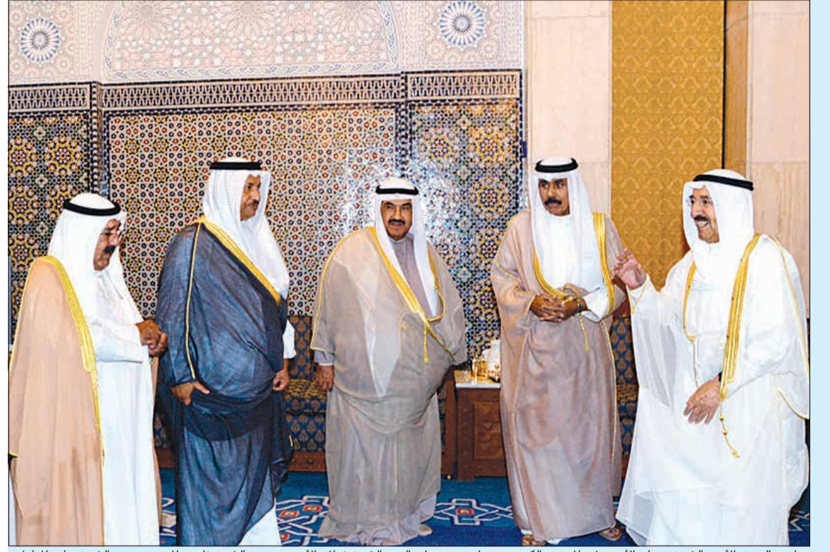
صاحب السمو الأمير الشيخ صباح الأحمد في المسجد الكبير ورجواره سمو ولي العهد الشيخ نواف الأحمد وسمو الشيخ ناصر المحمد وسمو الشيخ جابر المبارك والشيخ ناصر صباح الأحمد

كشفت مصادر نيابية في تصريحات خاصة لـ «الأنباء» عن أن المناقصة الخاصة بإعداد قانون الضرائب لم تطرح حتى الآن. وأضافت المصادر أنه لا ضرائب في المدينين القريب والمتوسط تنفيذاً لتعهد نائب رئيس الوزراء وزير المالية أنس الصالح «بأنه لا ضرائب في المدينين القريب أو المتوسط». وأعلنت أن وزير المالية أبلغ ممثلي جمعيات النفع العام أثناء لقاء وزراء المجموعة الاقتصادية بأنه «لا فرض لضريبة الشركات البالغة 10٪ أو لضريبة القيمة المضافة في المدينين القريب والمتوسط» وذلك في اللقاء الذي جمع الطرفين في يناير الماضي. وقالت المصادر إن المدى المتوسط يبدأ من يوم تعهد الوزير ويمتد حتى فترة لا تقل عن 5 سنوات. وكانت الحكومة قد اعتمدت في أغسطس الماضي مشروع قانوني لضريبة المضافة والضريبة الانتقائية لإحلتها إلى مجلس الأمة في الوقت الذي أكد بيان صادر من وزارة المالية أن الكلمة الفصل في تطبيق قانون الضريبة المضافة يرجع إلى مجلس الأمة.