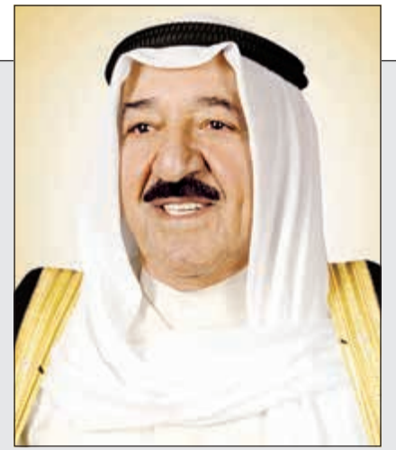
صاحب السمو الأمير الشيخ صباح الأحمد

الأمير يغادر إلى أميركا اليوم ويجري مباحثات مع ترامب 7 الجاري