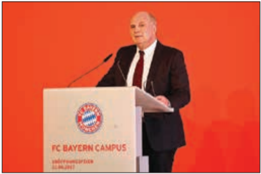
أولي هونيس رئيس بايرن ميونخ

قال أولي هونيس رئيس بايرن ميونخ إن القيمة الضخمة لصفقات انتقال لاعبي كرة القدم ستتضرر للغاية وقد تتسبب في إبعاد المشجعين.