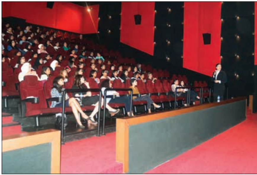
ميتشيل متحدة في الاجتماع