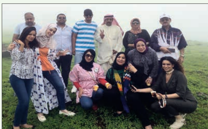
الوفد الاعلامي العربي في إحدى اطالات صلالة