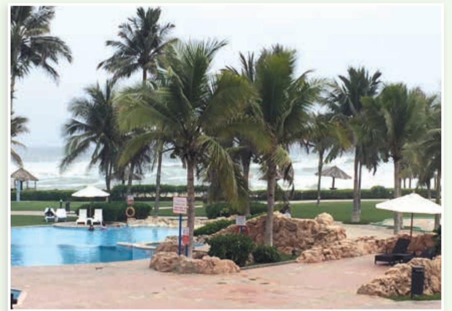
منتج يطل على المحيط الهندي