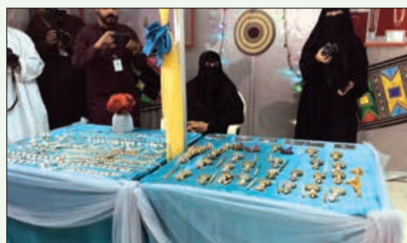
مشغولات يدوية عمانية

وهناك عدد من المواقع الدينية التي يحرص زوار صلالة على العروج إليها في سياحتهم بصلالة ومنها مقام النبي أيوب والذي يقع على جبل إتين في صلالة، يطل على مناظر طبيعية خلابة، تعددت الروايات حول هذا المقام، إحداهما تقول أنه دفن في جبل إتين، وأن المقام عبارة عن قبره الحقيقي.. تفضل زيارته في فصل الخريف للتمتع بالمناظر الطبيعية.