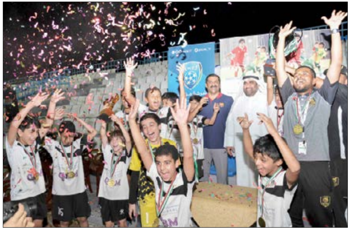
فرحة لاعبي «سوبرت فور أول» بتحقيق الكأس

عقد صباح أمس بستان جابر الدولي الاجتماع التنسيقي للقاء الكأس السوبر الذي سيجتمع بين الكويت والقادسية في السابع من شهر سبتمبر المقبل، وذلك بحضور أمين عام اتحاد الكرة د. محمد خليل ورئيس اللجنة الإعلامية بالاتحاد سطم السهلي ومدير المراقبة بالسنتاد المستشار محمد شاكر وممثلين عن الوزارات والهيئات المعنية. ورحب خليل بالحضور، معرباً عن أمنيته بأن يخرج لقاء السوبر تنظيمياً وفنياً وفقاً لما تم التخطيط بشكل مسبق له. وقال الأمين العام خلال الاجتماع ان الاستعدادات لكأس السوبر جاءت منذ فترة ليست بالقليلة، من أجل العمل على تلافى سلبيات البطولات السابقة، مؤكداً أن جميع اللجان العاملة بالاتحاد تبذل قصارى جهدها لتحقيق الهدف المنشود.