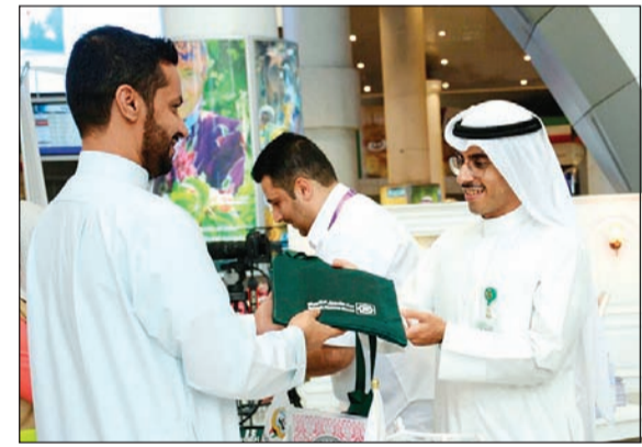
«بيتك» يقدم هدية لأحد الحجاج

يشارك بيت التمويل الكويتي (بيتك) في جهود وداع ورعاية وإرشاد الحجاج في مطار الكويت الدولي بالتعاون مع وزارة الصحة. المكتب الاعلامي، وذلك ضمن دوره الاجتماعي وحرصه على مشاركة المجتمع وإفراجه في مختلف المناسبات الدينية والوطنية والتعاون مع الجهات الرسمية فيما تنظمه من أنشطة او تقديمه من خدمات.