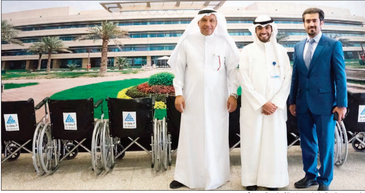
جانب من زيارة البنك لمستشفى الأمراض الصدرية

ومن هذا المنطلق، رأت إدارة البنك أهمية تبني مبادرة التبرع بالكراسي الطبية لخدمة المرضى وتسهيل عملية تنقلهم بين مرافق المستشفيات. والجدير بالذكر أن بنك الكويت الدولي يؤمن بأهمية مساهمة القطاع الخاص في تحسين الخدمات الطبية المتوفرة في المستشفيات الحكومية، وقد قام مؤخرا بتوزيع عدد من الكراسي المتحركة لمجموعة من المستشفيات للمساهمة في منح المرضى خدمة ورعاية طبية أفضل.