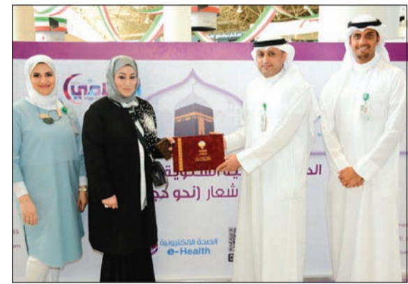
وزارة الصحة تكرم «بيتك»

من المكتب الاعلامي بوزارة الصحة بتعاون «بيتك» ووجوده مع طاقم العاملين في المكتب في الجناح الخاص بهم في مطار الكويت، وهذا ليس غريبا على «بيتك» الذي يساهم بشكل دائم في العديد من الفعاليات ودوره ومساهماته بارزة في مختلف المجالات، معتبرة هذه المشاركة دليلا جديدا على اهتمامه الكبير بحجاج بيت الله الحرام وسعيه لتقديم كل ما يسهل لهم رحلتهم وكذلك الاطمئنان عليهم والحرص على سلامتهم حيث تمثل النصائح والإرشادات والتوعية التي تقدمها اليوم عاملا مهما في تحقيق ذلك.