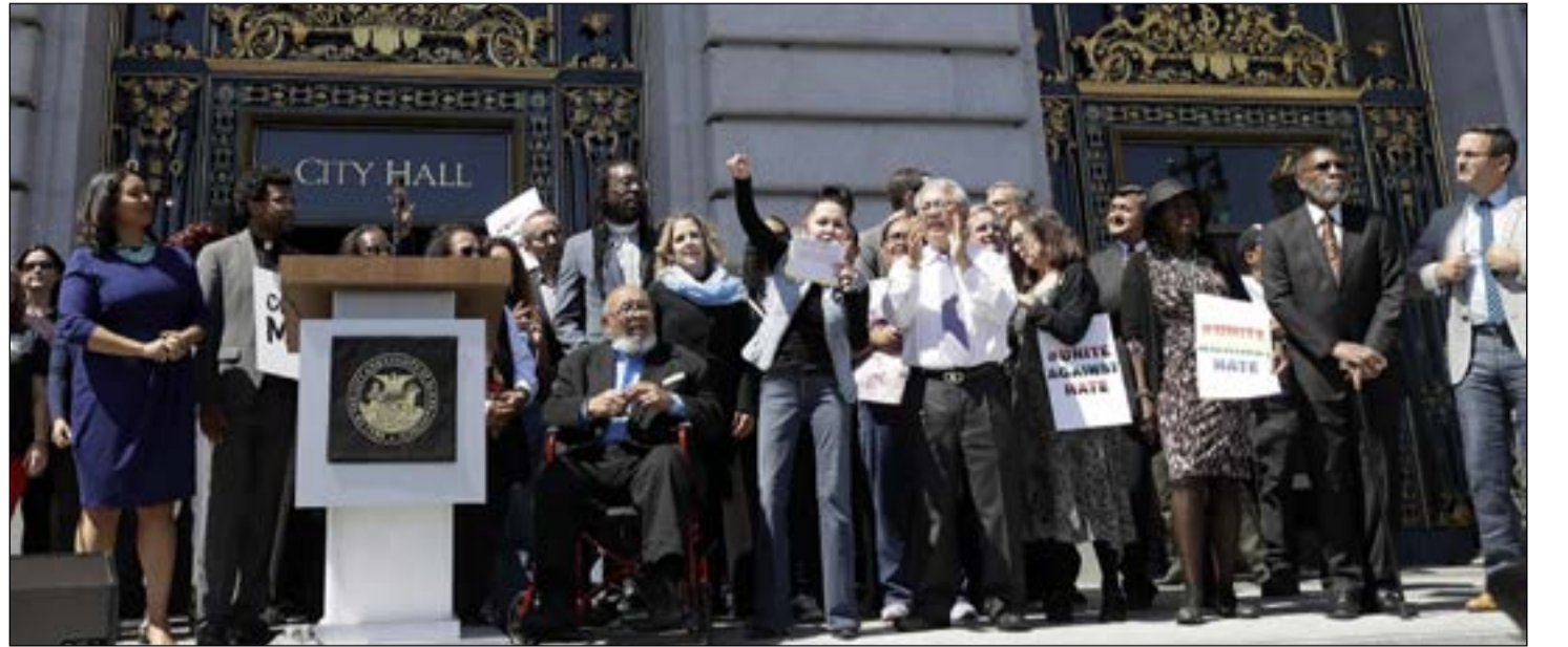
محتجون اميركيون يتوسطهم عمدة سان فرانسيسكو ينددون بالعنصرية خلال تظاهرة امام مقر مجلس المدينة امس الاول

الرئيس الأميركي تجاهل نصيحة وزير العدل بعدم العفو عن الشرطي «العنصري»