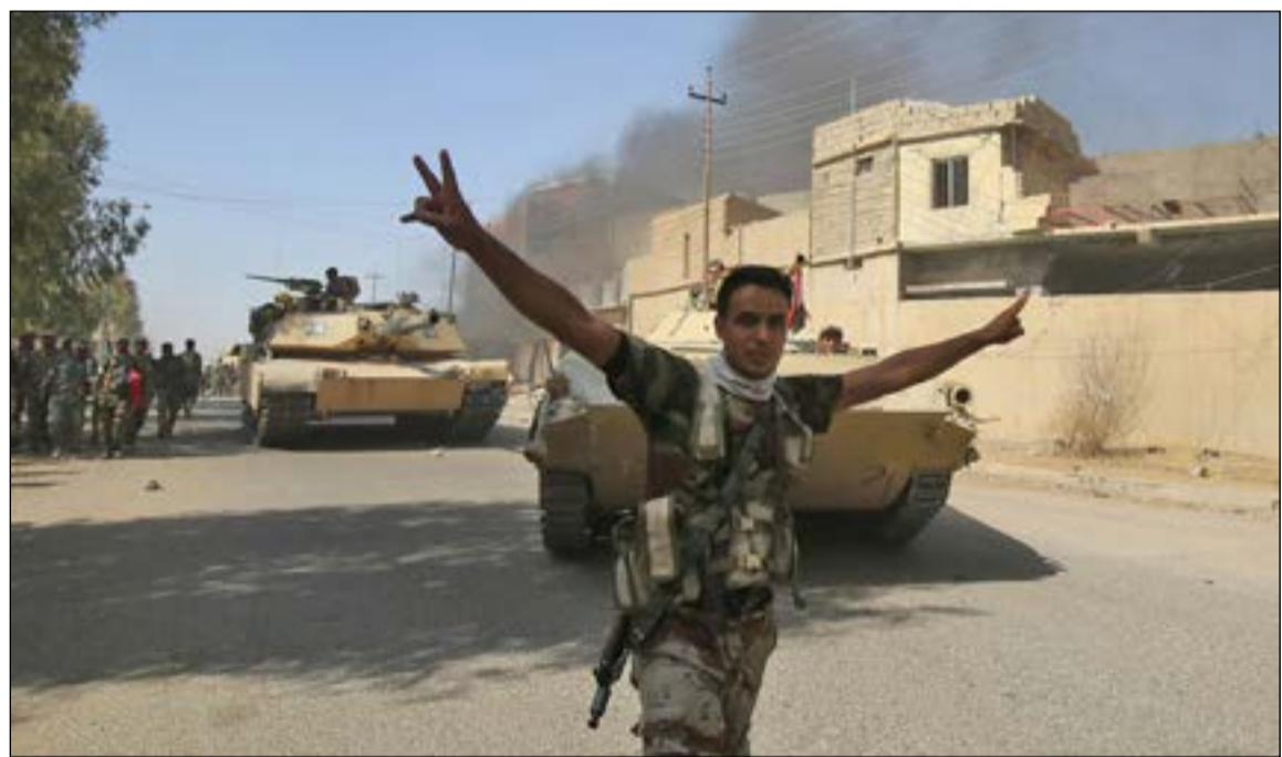
جندي عراقي يلوح بعلامة النصر خلال تقدم القوات المشتركة في قلب تلعفر امس

بغداد - وكالات: أعلنت القيادة العامة للقوات المشتركة العراقية امس، السيطرة الكاملة على قضاء تلعفر الواقع غربي الموصل وتوجهها نحو العياضية «آخر معاقل ما يسمى تنظيم «داعش» في المنطقة». وقال قائد عمليات «قادمون يا تلعفر» الفريق قوات خاصة الركن عبد الأمير يار الله في بيان صحافي امس أنه تم إنجاز التحرير الكامل لمركز قضاء تلعفر والقوات المشتركة اتجهت الى تحرير ناحية العياضية والمناطق المحيطة بها. وأوضح يار الله ان الفرقة المدرعة التاسعة تمكنت من السيطرة على حي العسكري وحى الصناعة الشمالية ومنطقة المعارض وبوابة تلعفر وقرية الرحمة مضيفاً انه لم يتبق سوى ناحية العياضية والقرى المحيطة بها. وأوضح أنه في مجمل منطقة تلعفر «تمت استعادة السيطرة على 1155 كلم مربعاً من أصل 1655 كلم مربعاً، أي 70% من المنطقة»، من جهته، قال المتحدث باسم الجيش العراقي العميد يحيى رسول إن القوات تنتظر استعادة العياضية، حيث يدور قتال شرس هناك، حتى تعلن