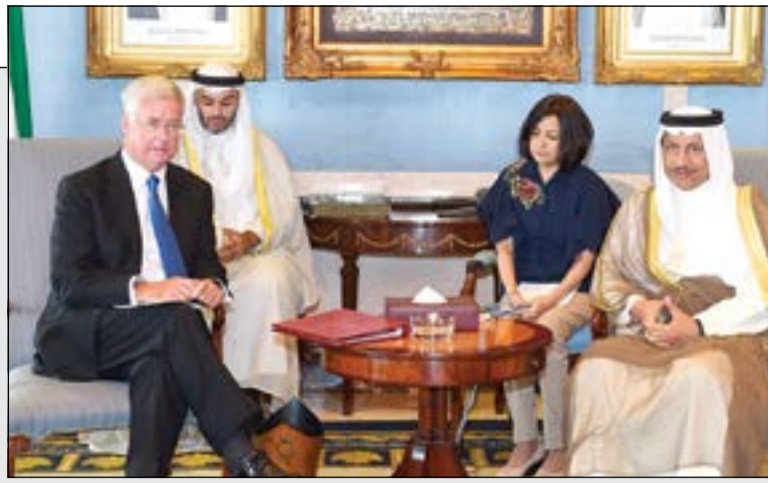
سمو رئيس الوزراء الشيخ جابر المبارك مستقبلا وزير الدفاع البريطاني

وزير الدفاع البريطاني التقى رئيس الوزراء والخالد وقد أمر القوة البرية وسام كلية «ساندهيرست» رفيع المستوى 04