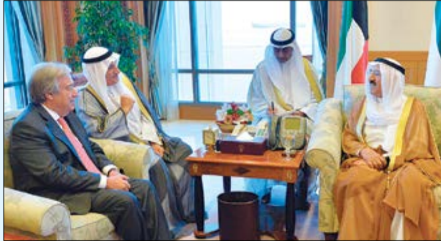
صاحب السمو الأمير الشيخ صباح الأحمد مستقبلا الأمين العام للأمم المتحدة أنطونيو غوتيريس

أعرب صاحب السمو الأمير الشيخ صباح الأحمد عن خالص اعتزازه بما قدمه المغفور له بإذن الله تعالى الفنان الكبير عبدالحسين عبدالرضا للوطن العزيز، مؤكدا سموه أن الكويت الفنية والمسرحية الذين أسهموا في تأسيسها وإثرائها، وذلك من خلال ما قدمه من أعمال وطنية وفنية عالج من خلالها العديد من القضايا المختلفة، مقدرا سموه سنوات العطاء التي رسخها الفقيه في خدمة المسيرة الفنية الكويتية.