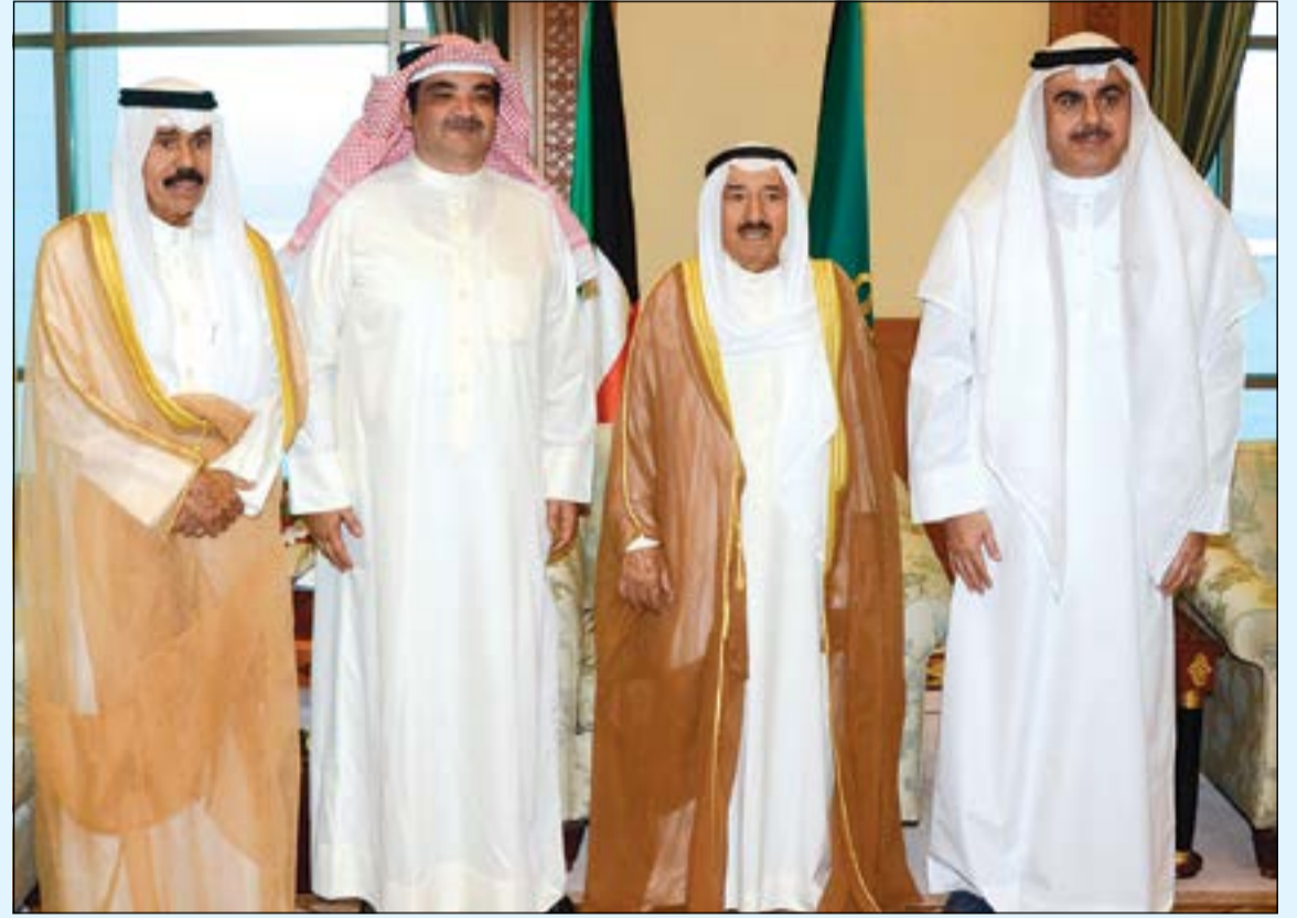
صاحب السمو الأمير الشيخ صباح الأحمد وسمو ولي العهد الشيخ نواف الأحمد مع عدنان وبشار نخلي الراحل عبدالحسين عبدالرضا

هذا استقبال صاحب السمو الأمير الشيخ صباح الأحمد الأمين العام للأمم المتحدة أنطونيو غوتيريس والوفد المرافق، وذلك بمناسبة زيارته للبلاد. وأعرب الأمين العام للأمم المتحدة عن بالغ شكره وتقديره للدور القيادي البارز لسموه في مجال العمل الإنساني، معبرا عن خالص امتنانه لجهود الكويت فيما يخص جميع القضايا السياسية والإنسانية ودور سموه الإيجابي والنشط ووساطته في الأزمة