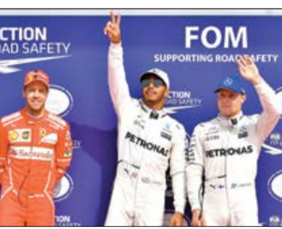
هاميلتون يتوسط فيتل وبتواس

سيكون سائق مرسيدس البريطاني لويس هاميلتون أول المنطلقين في سباق جائزة بلجيكا الكبرى، المرحلة الثانية عشرة من بطولة العالم للفورمولا 1 اليوم، بعد تحقيقه امس المركز الأول للمرة 68 في مسيرته، معادلا الرقم القياسي للألماني ميكائيل شوماخر.