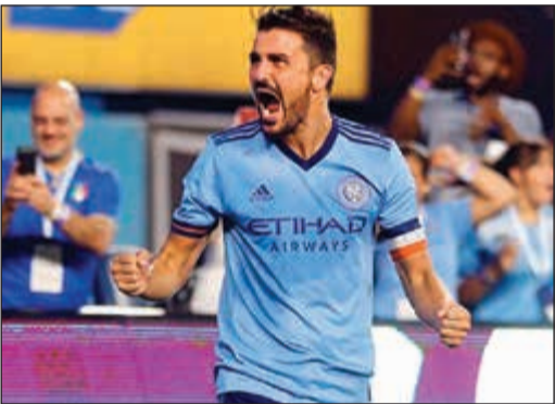
دافيد فيا يعود للمنتخب بعد غياب ثلاث سنوات

عاد دافيد فيا (35 عاماً) مهاجم نيويورك سيتي الأميركي إلى تشكيلة منتخب إسبانيا لكرة القدم للمرة الأولى منذ ثلاثة أعوام، وذلك للمبارتين ضد إيطاليا وليشتنشتاين، في تصفيات مونديال 2018، حسبما أعلن الاتحاد الإسباني أمس. وتلقى إسبانيا مع إيطاليا في 2 سبتمبر، ومع ليشتنشتاين في 5 منه.