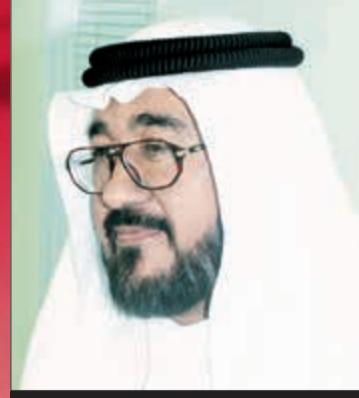
بقلم: يوسف عبد الرحمن