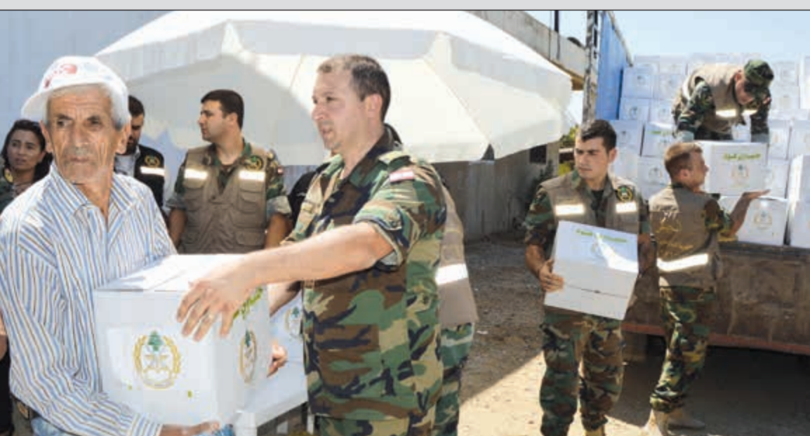
وحدات من الجيش اللبناني خلال توزيع حصص غذائية على بعض عائلات عرسال والبقاع واللوية في إطار برنامج التعاون العسكري - المدني (CIMIC) (محمود الطويل)

معبر الزيداني)، وهذا الكلام يدحض النظريات القائلة بغياب التنسيق بين الجيش اللبناني والمقاومة والجيش السوري. ● الكشف عن مفاوضات بدأت مع تنظيم «داعش» بعد أخذ موافقة الحكومة السورية، ومن دون إذن الحكومة اللبنانية. وهذا التفاوض سيجري تحت النار ولن يكون هناك وقف لإطلاق النار قبل التوصل إلى اتفاق، وسيكون شرطه الأول كشف مصير الجنود اللبنانيين، وسيكون هدفه «إنهاء وجود داعش على الأرض السورية واللبنانية». ● مطالبة الجانب اللبناني «الرسمي» في حال أراد البدء بالتفاوض أن يأخذ في الاعتبار أن أي اتفاق يتوصل إليه ليس قابلاً للتنفيذ من دون تعاون القيادة السورية، وهذا التعاون شرطه أن تطلب الحكومة اللبنانية رسمياً من دمشق التعاون لإنجاح المهمة، وأن تنسق علناً و«فوق الطاولة». ● اعتبار أن هذا الإنجاز الكبير (تأمين الحدود اللبنانية السورية بالكامل وتحرير الأرض اللبنانية وطرد «داعش» منها والضغط للكشف عن مصير العسكريين المخطوفين في اليوم الأول من المعركة) قلعة الحصن وقلعة بونين في اتجاه