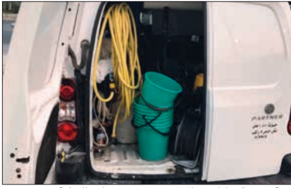
خدمة غسيل السيارات من المنزل دون ترخيص تجاري للمركبة

إعلان تجاري غير مرخص على وسيلة نقل، لافتاً إلى أن البلدية شددت مرارا على عدم مزاوله أي نشاط تجاري بوسيلة نقل من سيارة أو باص وغيرهما من غير المرخصة والتي لا تحمل موافقة البلدية بما يخالف لائحة الباعة المتجولين ومزاولة الحرف. وتشدد العنزي على أن