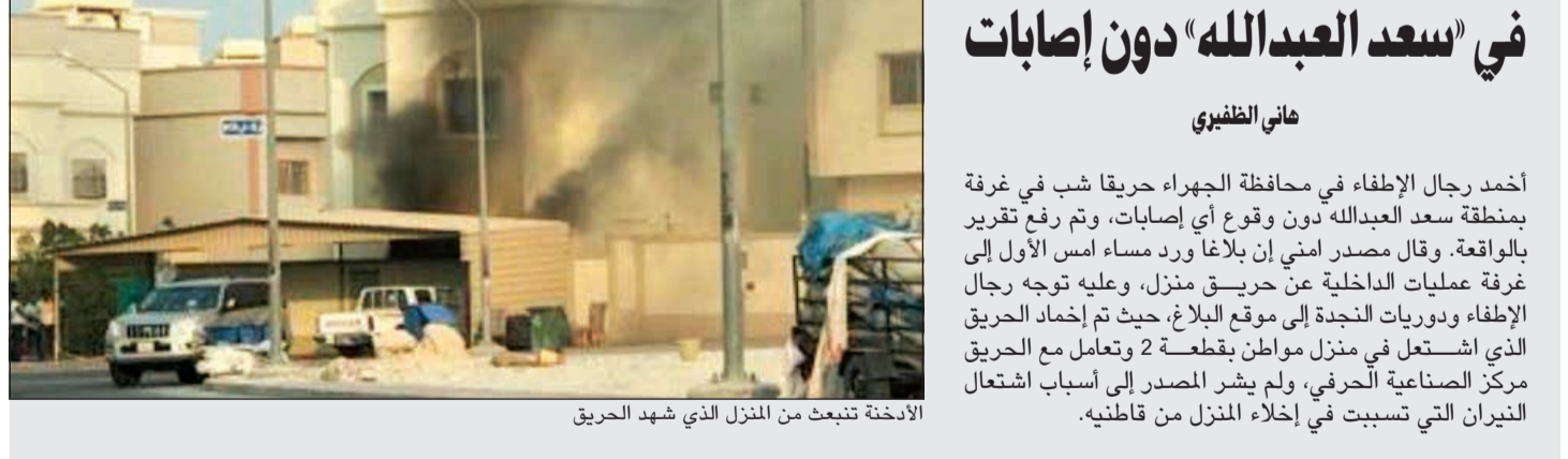
الأدخنة تتبعث من المنزل الذي شهد الحريق

أحمد رجال الإطفاء في محافظة الجهراء حريقا شب في غرفة بمنطقة سعد العبدالله دون وقوع أي إصابات، وتم رفع تقرير بالواقعة. وقال مصدر امني إن بلاغا ورد مساء أمس الأول إلى غرفة عمليات الداخلية عن حريق منزل، وعليه توجه رجال الإطفاء ودرجات النجدة إلى موقع البلاغ، حيث تم إخماد الحريق الذي اشتعل في منزل مواطن بقطعة 2 وتعامل مع الحريق مركز الصناعية الحرفي، ولم يضر المصدر إلى أسباب اشتعال النيران التي تسببت في إخلاء المنزل من قاطنيه.