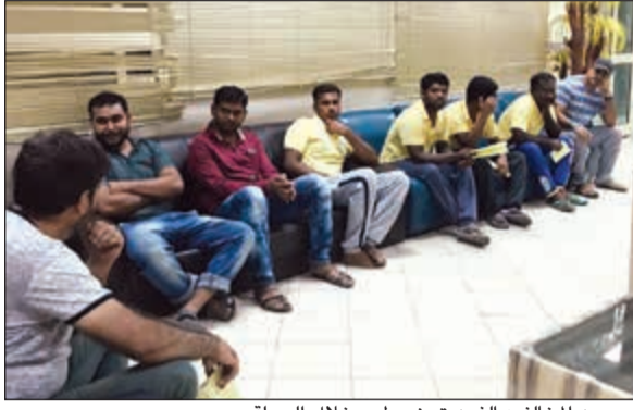
عدد من المخالفين الذين تم ضبطهم خلال الحملة