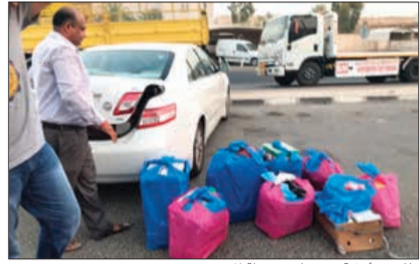
ملابس وأحذية ومنتجات مجهولة المصدر

العنزي: مخالفات مزاوله نشاط تجاري بوسيلة نقل غير مرخصة من البلدية