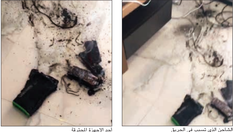
أحد الأجهزة المحترقة