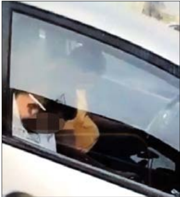
الشبابان وقد غطا في سبات داخل المركبة

شهد طريق الدائري السادس السريع حادث تصادم بين مركبتين جاز نوم شابين بسيارتهم التي توقفا بها بمنتصف الطريق دون ان تعرف الأسباب التي دفعتهم الى النوم بسيارتهم التي قام احد المارة بتصويرهما وهما نائمان بداخلها. وقال المصدر ان الواقعة حدثت يوم امس الاول على طريق الدائري السادس السريع وأن الشخص الذي قام بتصوير المقطع كان يعتقد أن المنسحب بالحادث امرأة وعند وصوله الى المركبة المتوقفة في منتصف الطريق اتضح ان قائد المركبة ومرافقه وهما شابان كانا في سبات عميق وحاول الشخص الذي صور المقطع إيقافهما الا انهما كانا نائمين وتبين انهما وأثناء توقفيهما بمنتصف الطريق تسببا بحادث بين