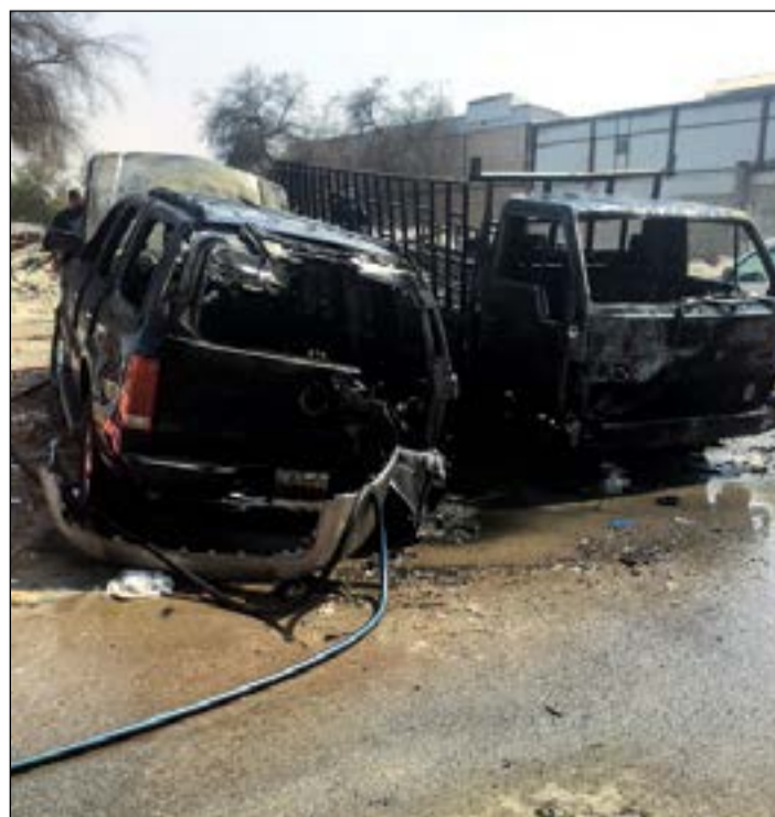
حريق المركبتين في الشويخ خلف سحبا دخانية كثيفة

قال مصدر أمني ان انقطاع التيار الكهربائي عن عزل سجن «أ» الذي أقدم فيه النزيل الخليجي على الانتحار هو من كشف عن الواقعة، مشيراً إلى