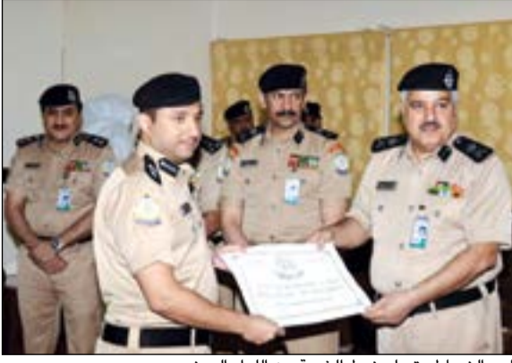
أحد الضباط يتسلم نوط الخدمة من اللواء العوضي