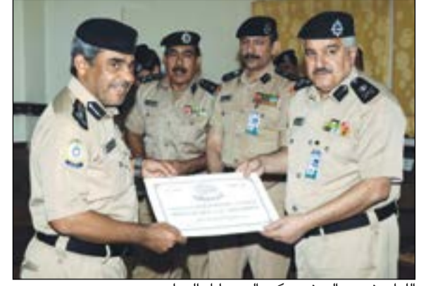
اللواء منصور العوضي يكرم العميد أياد الحداد

اللواء العوضي بتوزيع شهادات أنواط الخدمة على المقلدين، وذلك بحضور المديرين العامين ومساعديهم بقطاع أمن المنافذ.