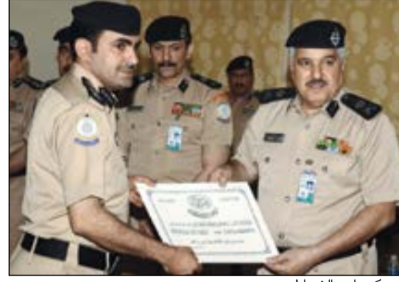
.. ويكرم أحد الضباط