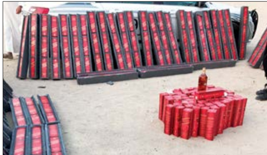
جانب من الخمور المضبوطة