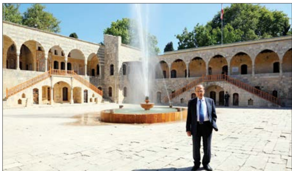
الرئيس اللبناني العماد ميشال عون في المقر الرئاسي الصيفي في بيت الدين (محمود الطويل)

واقترح عون ان يكون لكل نائب رديف يحل محله اذا عين النائب وزيرا او اذا شغل المقعد لأي سبب ما يسمح بالاعتقاد انه لن تكون هناك انتخابات فرعية لسند الشواغر النيابية الخالفة في طرابلس وكسروان. من جهته، أطلع رئيس الحكومة سعد الحريري مجلس الوزراء على نتائج زيارته إلى مواقع الجيش في الجرد الشرقية، مشيدا بالمعنويات العالية لدى العسكريين والعمل الحرفي الكبير الذي قاموا به والانجازات التي حقوها، بحيث يسبق ان ينتشر بها، مؤكدا ان المرحلة سيتمركز في كل الاماكن التي حررت من الارهابيين. وفيما يوحي بقرب انتهاء العملية العسكرية، نقلت رويترز عن مسؤول من الميليشيات التي قتلت الى جانب الجيش السوري على الطرف المقابل من الحدود اللبنانية، ان داعش طلب من الجيش وحليفه حزب الله السماح له بالانسحاب من الحدود