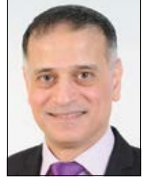
إعداد: د. طارق البكري