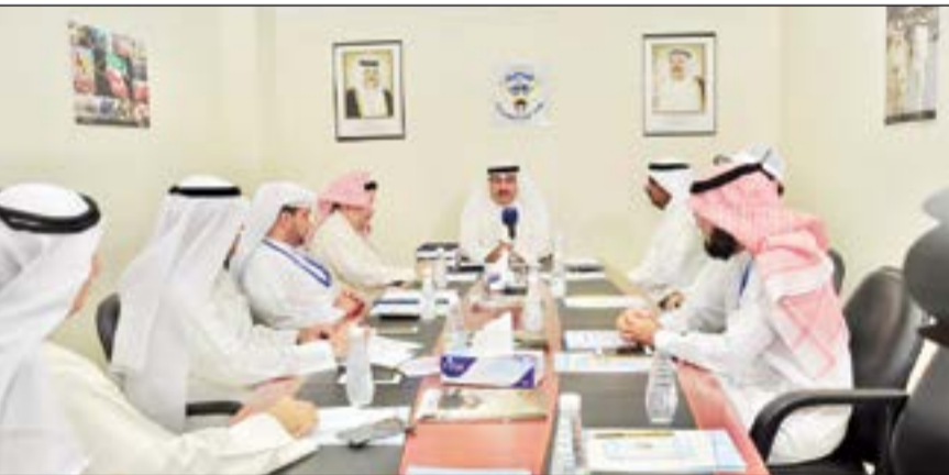
خليفة الأذينة خلال الاجتماع

ما يؤكد أننا نسير في الاتجاه الصحيح، وقد نتج عن ذلك تسلمنا جميع الأراضي الخاصة بنا في عرفات ومني وأخرها أراضي مزدلفة، بوقت مبكر، وذلك نتيجة للتعاون الكبير مع مؤسسة الدول العربية للطواف، كما أن العمل جار على قدم وساق لتجهيز مقر البعثة في تلك الأراضي. وأشاد بالخبرات التي تتمتع بها جميع فرق البعثة، خصوصا أن الكثير منهم يشاركون معها منذ سنوات عدة وذلك نتيجة لتميزهم، وهذا ما مكّنهم من أداء عملهم بكل يسر وسهولة منذ وصولهم إلى الأراضي المقدسة، وهو أيضا ما جعل بعثة الحج الكويتية تتمتع بالريادة في العمل، وما يؤكد قدرتها على الاستمرار في التميز والريادة. وشدد على ضرورة الالتزام باللوائح والقوانين الصادرة من المملكة العربية السعودية، مؤكدا عدم تهاون أو تساهل بعثة الحج الكويتية في هذا الأمر، من أجل المساهمة في إنجاز موسم الحج، خصوصا أن للبلدين الكويت والسعودية مكانة مميزة في قلوب الشعبين والمسؤولين في البلدين، ومن الضروري أن تترجم هذه المكانة على أرض الواقع، وذلك من خلال التزام الحملات الكويتية باللوائح والقوانين السعودية.