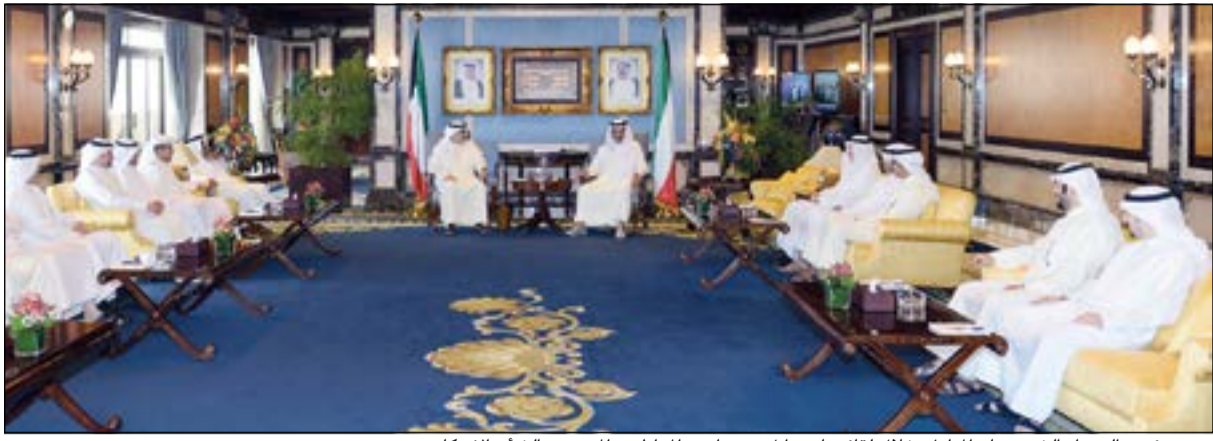
سمو رئيس الوزراء الشيخ جابر المبارك خلال لقائه ياسر أبل وعددا من المواطنين المهتمين بالملف الإسكاني

وأكد سموه حرص الحكومة على تنفيذ توجيهات صاحب السمو الأمير واهتمامه الدائم بالقضية الإسكانية وتأكيد على تذليل كافة العقبات أمام تنفيذ عقود المشاريع الإسكانية الضخمة وفق الأطر الزمنية المحددة في برامج خطة التنمية. وبين سموه أن إنجاز المشاريع الإسكانية الجديدة يتم على قدم وساق لتشمل جميع الخدمات والتسهيلات للمواطنين بما يحقق تطلعاتهم الكبيرة في هذا الصدد، مشيدا بما حققته المؤسسة العامة للرعاية السكنية من إنجاز متمثل في تقليل المدة الزمنية للانتظار للحصول على الوحدات السكنية للأسر الكويتية وكذلك الأخوة أعضاء مجلس الأمة الذين يولون القضية الإسكانية اهتماما كبيرا. وقال سموه إن الحكومة تعي