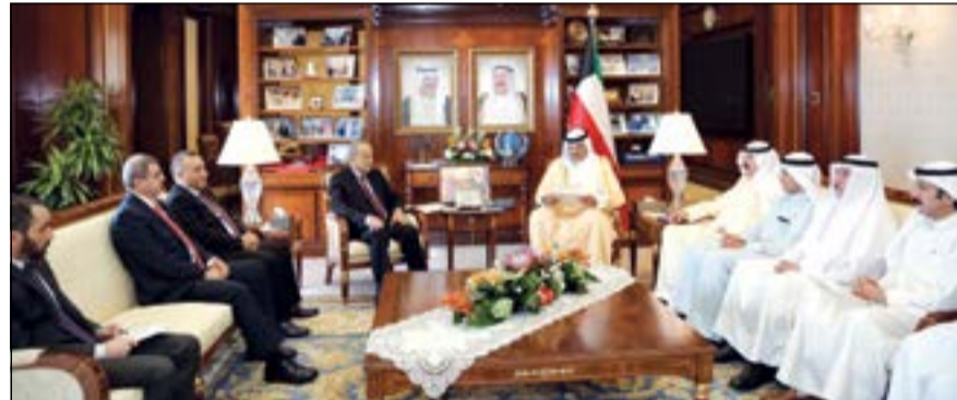
الشيخ صباح الخالد مستقبلا وزير خارجية جمهورية العراق د.إبراهيم الجعفري

تسلم الشيخ صباح الخالد النائب الأول لرئيس مجلس الوزراء ووزير الخارجية رسالة خطية من وزير خارجية جمهورية العراق الشقيقة د.إبراهيم الأشقر الجعفري تتعلق بالعلاقات الثنائية بين البلدين الشقيقين والقضايا محل الاهتمام المشترك.