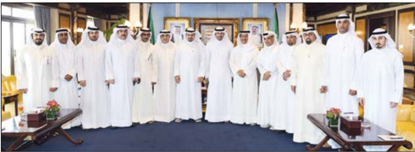
سمو رئيس مجلس الوزراء الشيخ جابر المبارك متوسطا الوزير ياسر أبل وعدد من المواطنين المهتمين بالشأن الإسكاني