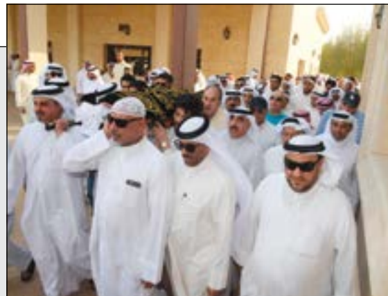
جثمان الفقيد الفنان حسين جاسم قبل مواراته الثرى أمس (محمد هاشم)