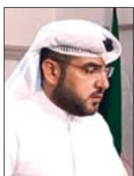
د. عبد الكريم الكندري

برفع قضايا دولية ضد الكويت في جنيف. وأوضح الكندري أن الكويت لا بد أن تتحرك في مسارين يتعلق الأول بالشق القانوني الذي يحتم على الحكومة التأكد من صحة هذه القضية واستعداد الفتوى والتشريع للرد والدفاع عن الكويت. وأضاف ان الشق الثاني يتعلق بخطوات يجب ان يتخذها البرلمان على المستوى التشريعي لحماية الكويت من القضايا التي