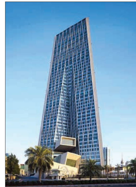
مبنى بنك الكويت المركزي

من جانب آخر، تباطأت القروض المقسطة هي الأخرى حيث نمت القروض المقسطة بنسبة 0.13٪ إلى 10.47 مليار دينار لتسجل زيادة سنوية بلغت 8.14٪. وسجلت القروض الممنوحة للعقار ارتفاعا شهريا طفيفا بلغ 0.76٪ إلى 8 مليارات دينار، بينما سجلت نموا طفيفا بالمقارنة بـ 2016 بنحو 0.3٪. وكشفت بيانات المركزي زيادة بواقع 2.8٪ للقروض الممنوحة لقطاع النفط والغاز لتبلغ 150 مليون دينار فيما بلغ المستحق خلال الشهر الماضي نحو 300 مليون دينار، ويذكر