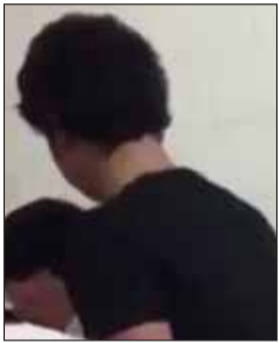
المقطع الذي تم تداوله