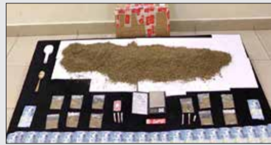
الكيميكاإل والهيروين المضبوط بعد مدهامة منزل أسبوي

الإجراء القانوني وضبطه وبتفتيش شاحنته عثر على ما يقارب 2 كيلو من مادة الهيروين و كيلو من مادة الشبو المخدرة وبمواجهته اعترف بما نسب اليه كما أفاد بأنه يقوم بتسليمها لأحد معاونيه من الجنسية العربية وتم ضبطه، وأحيل المتهمان والمضبوطات إلى جهة الاختصاص لاتخاذ الإجراءات القانونية بحقهم.