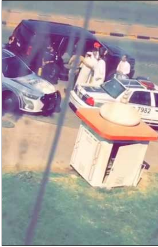
الجاني لحظة القبض عليه

وتابع: انطلقت الى طريق الدائري الخامس وتوقفت على كتف الطريق ونزلت حاملاً السكين وهددته بانني سوف اقتله، وفي لحظة ما وجدت نفسي اسد له طعنة في الكتف ولكن على ما يبدو انها وصلت الى القلب، وحينما وجدت الدماء تسيل منه سارعت به الى مستشفى الصباح لتقديم الإسعافات له وهربت وذهبت الى والدي لأبلغه بما حدث وبعد ذلك تم ضبطي.