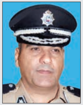
اللواء خالد الدين

حساس و2 كيلو من مادة الهيروين و كيلو من مادة الشبو المخدرة. وكانت معلومات قد وردت للمكافحة بأن أحد الأشخاص يحوز وجرز مواد مخدرة بقصد الاتجار، فتم إجراء التحريات بهدف التأكد من صحة المعلومات، وبعد اتخاذ الإجراء القانوني اللازم تم مدهامة منزله وضبطه وبتفتيشه عثر معه على 5