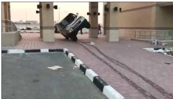
لقطات من مقطع الاستهتار والرعونة الذي تم تداوله على وسائل التواصل الاجتماعي