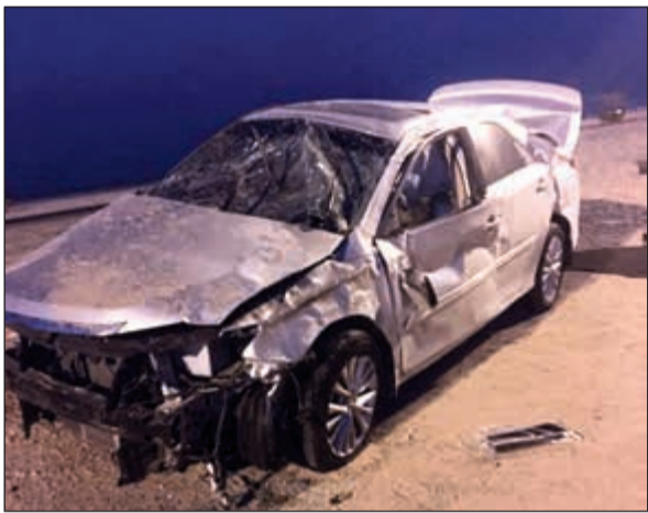
مركبة الخليجي التي انقلبت على طريق السالمي

وأجرى رجال المرور معاينة للمركبة في محاولة للوقوف على ملابسات الحادث وسلمت الجثة إلى الطب الشرعي.