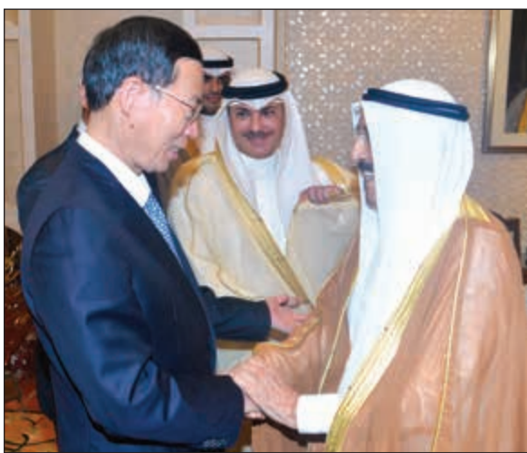
صاحب السمو الامير مرجبا بنائب رئيس مجلس الوزراء الصيني