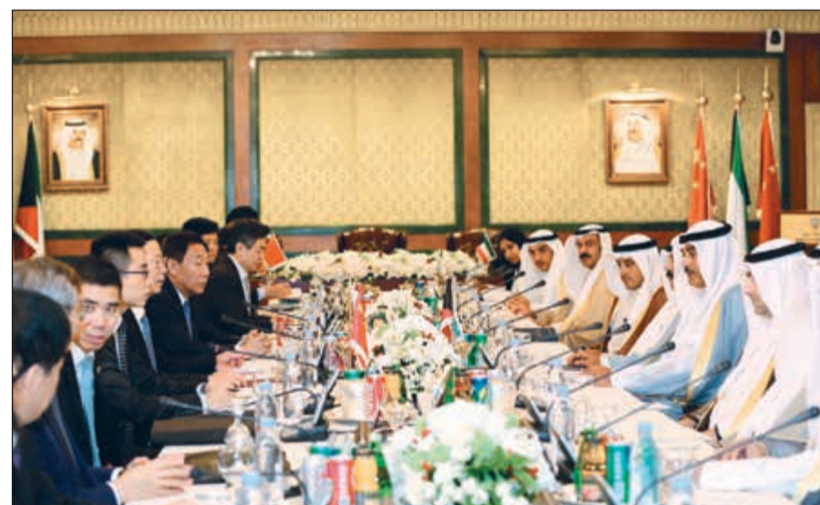
الشيخ صباح الخالد وياسر أبل وخالد الجارالله خلال الاجتماع مع الجانب الصيني

عقدت صباح امس في ديوان عام وزارة الخارجية جلسة المباحثات الرسمية بين الكويت وجمهورية الصين الشعبية الصديقة. وترأس الشيخ صباح الخالد النائب الأول لرئيس مجلس الوزراء ووزير الخارجية الجانب الكويتي وبحضور وزير الدولة لشؤون الإسكان ووزير الدولة لشؤون الخدمات ياسر أبل، فيما ترأس الجانب الصيني نائب رئيس مجلس الدولة لجمهورية الصين الشعبية تشانغ قاو لي.