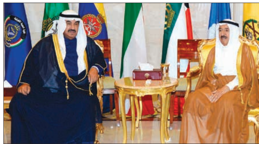
صاحب السمو الامير الشيخ صباح الاحمد مستقبلا سمو الشيخ ناصر المحمد