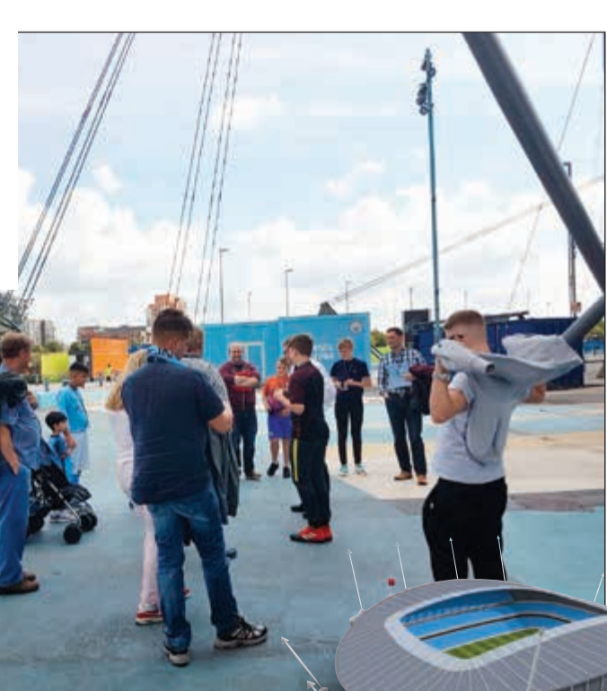
وفود زائرة لسيتي على مدار السنة