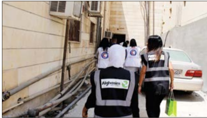
موظف صناعات الغانم في الطريق إلى أحد المنازل

نسبة من أرباح بيع كل سيارة جديدة من سيارات كاديلاك، ومنذ وصول العلامة التجارية كاديلاك إلى الكويت، واصلت كاديلاك قيادة القطاع من ناحية التصميم والهندسة في البلاد. ومنذ عقد الشراكة بين صناعات الغانم وجنرال موتورز، واصل عملاء كاديلاك المتمتع بمرافق رائعة، وأكبر مركز خدمة جنرال موتورز في العالم. هذا الحرص على التميز في خدمة العملاء هي جزء لا يتجزأ من هوية كاديلاك الغانم، وينعكس من خلال تركيزها على العملاء في جميع عملياتها.