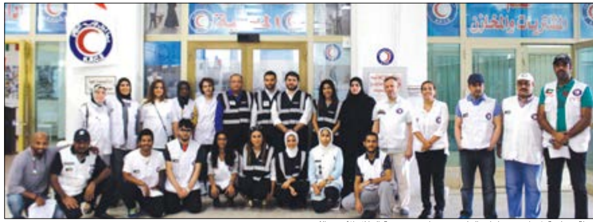
لقطة جماعية لموظفي صناعات الغانم مع متطوعي جمعية الهلال الأحمر الكويتي