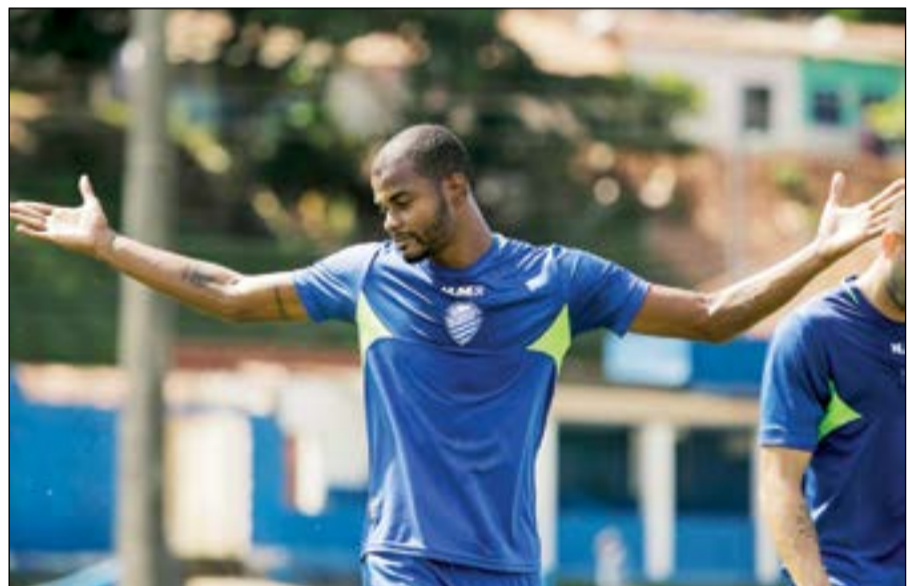
المدافع البرازيلي جورج فيلبي

البرتغالي «برازيلي» إلا أن فرنانديز سيسجل كأسوي بسبب لوائح لجنة المسابقات في اتحاد الكرة التي تسمح بتسجيل 3 محترفين ولاعب أسوي وبالتالي لن يسجل فرنانديز كلاعب برازيلي.