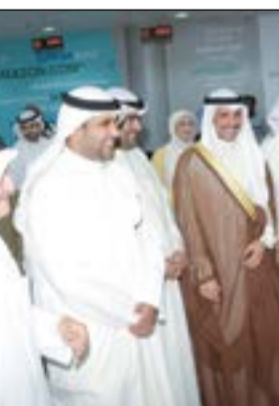
مرزوق الغانم وخالد الروضان خلال جولة في مركز الكويت للأعمال