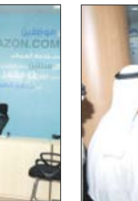
لقطة لمركز الكويت للأعمال الجديد في منطقة إشبيلية

التشجيعية، وأن التجارة سترد التحية بتحية أكبر منها. وحول تراخيص المشاريع الحرفية قال الروضان أن هناك لجنة تعمل على دراسة التراخيص المختلفة على دفعات، مشيرا إلى أن التراخيص الحرفية تعتبر من التراخيص المهمة جدا بالنسبة لوزارة التجارة والصناعة، وأن هناك بعض البرامج الحرفية والزراعية وغيرها من البرامج التي سيتم الإعلان عنها في حينها.