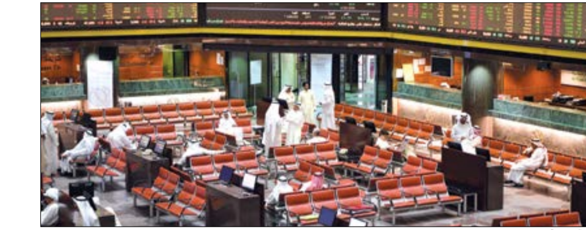
زخم البورصة مستمر

نحو 320 مليون دينار مكاسب، وذلك ببلوغها 28,946 مليار دينار ارتفاعا من 28,627 مليار دينار، وبذلك ارتفعت مكاسب القيمة الرأسمالية منذ بداية العام إلى 11%. وأنهت المؤشرات تعاملاتها الأسبوعية على النحو التالي: ● ارتفاع مؤشر العام بنسبة 0,6٪، محققا 41 نقطة مكاسب ليصل المؤشر إلى 6886 نقطة. ● حقق المؤشر الوزني ارتفاعا بنسبة 1,2٪، بتحقيق 5 نقاط مكاسب ليصل إلى 429 نقطة. ● ارتفع مؤشر كويت 15 بنسبة 0,8٪، محققا 8 نقاط مكاسب ليصل إلى 968 نقطة.