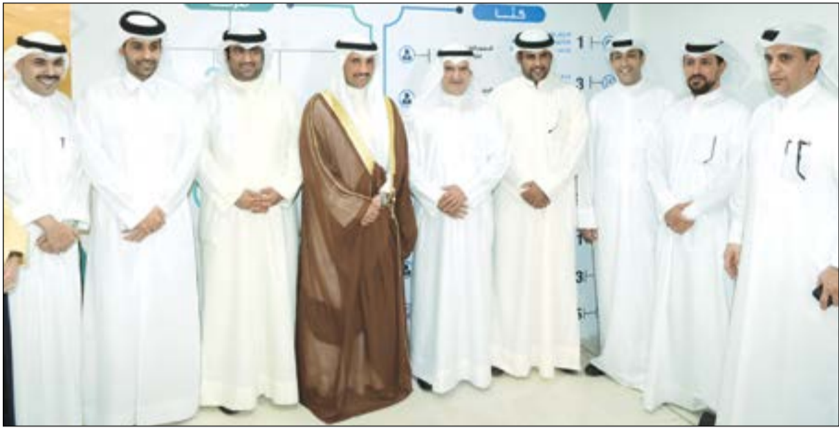
مرزوق الغانم وعصام المرزوق وخالد الروضان وأحمد الفارس ومحمد بن عبدالله آل ثاني خلال تدشين مركز الكويت للأعمال

قال رئيس مجلس الأمة مرزوق الغانم إن المشاريع متناهية الصغر ستوفر فرصا كبيرة أمام الشباب الكويتي للخروج من القطاع الحكومي والتوجه للعمل في القطاع الخاص وتحسين مردوده الاقتصادي. وأضاف في تصريحاته للصحافيين عقب إصدار أول ترخيص للمشاريع متناهية الصغر من «مركز الكويت للأعمال» الواقع بمنطقة إشبيلية أن إصدار تراخيص المشاريع متناهية الصغر خطوة مهمة لحل المشكلة الاقتصادية، خاصة أن أحد أسباب التضخم الحالية هي عدم توفر فرص للعمل بالقطاع الخاص.