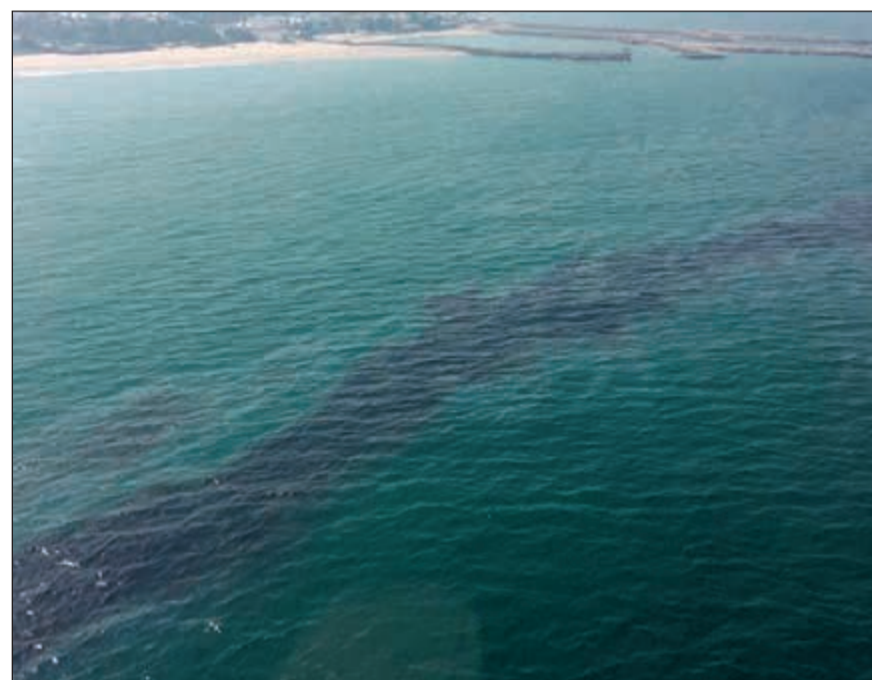
بقعة زيت جديدة رصدت في المنطقة البحرية المقابلة لنادي الشرطة

أعلنت الهيئة العامة للبيئة عن رصد بقعة زيت جديدة بالمنطقة البحرية المقابلة لنادي الشرطة بطول ميل بحري. وأكدت الهيئة في بيان لها أمس أنه جار عمل اللازم للمكافحة والتصدي للبقعة، كما يجري التنسيق والتعاون مع القطاع النفطي والإدارة العامة لحفر السواحل والمنظمة الإقليمية لحماية البيئة البحرية لتحديد الآلية المناسبة لذلك. وأهابت الهيئة بالمواطنين والمقيمين ومرتادي البحر توخي الحذر في السباحة أو القيام بأي أنشطة بحرية في المناطق المعلنه خلال الفترة الحالية لحين الانتهاء من أعمال المكافحة.