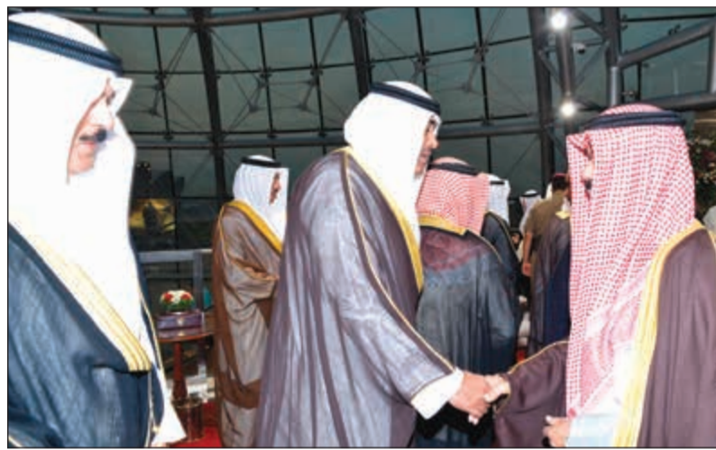
سمو ولي العهد الشيخ نواف الاحمد مصافحا الشيخ صباح الخالد والشيخ محمد خالد