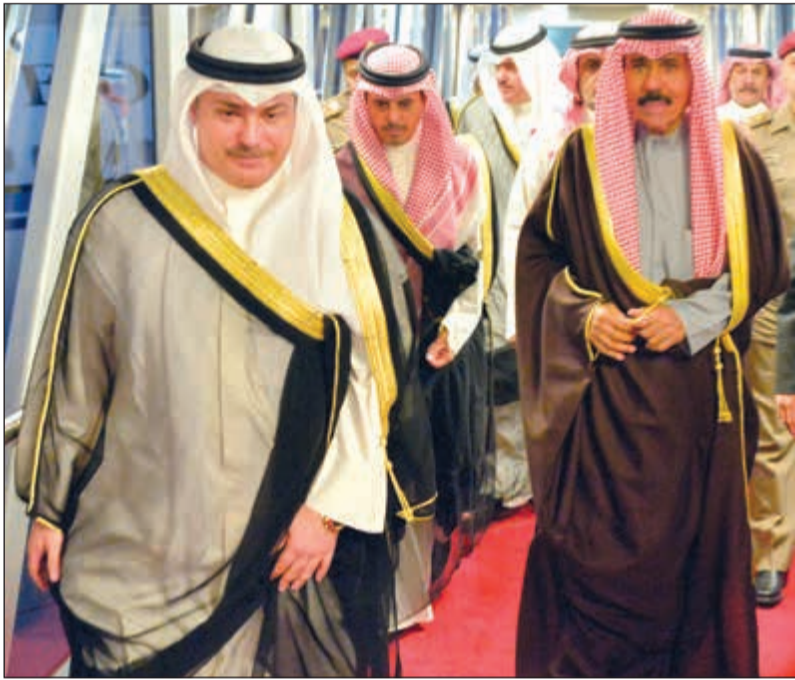
سمو ولي العهد الشيخ نواف الاحمد لدى وصوله الى أرض الوطن ويبدو الشيخ خالد العبدالله