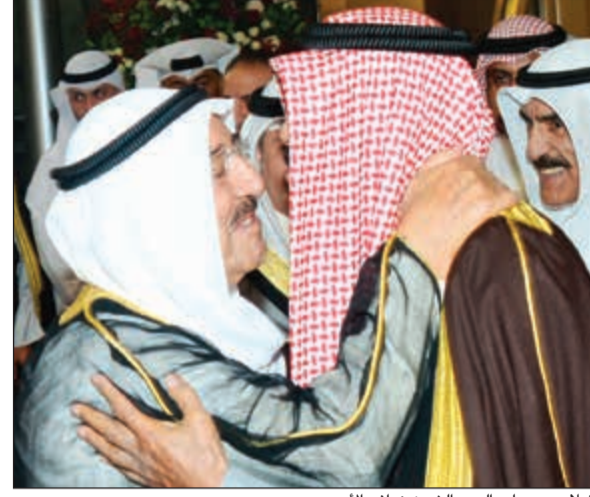
صاحب السمو الامير الشيخ صباح الاحمد مستقبلا سمو ولي العهد الشيخ نواف الاحمد