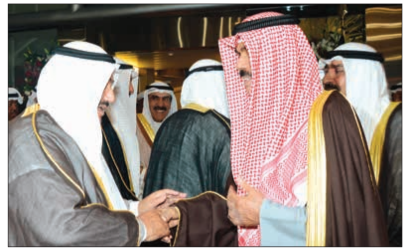
سمو ولي العهد وفي استقباله سمو الشيخ ناصر المحمد