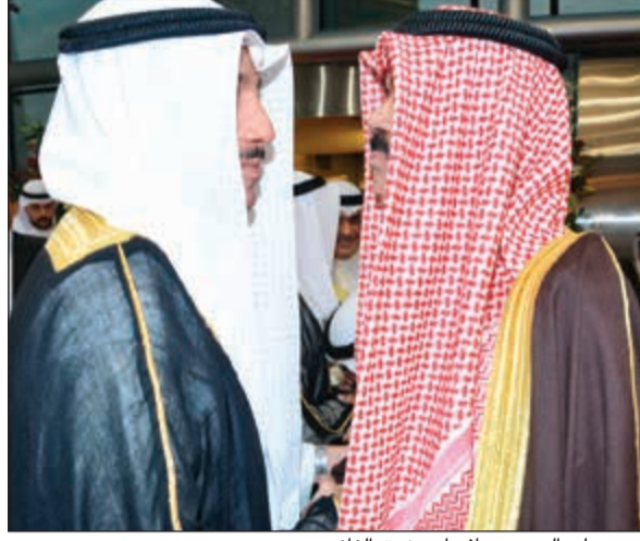
سمو ولي العهد مصافحا مرزوق الغانم