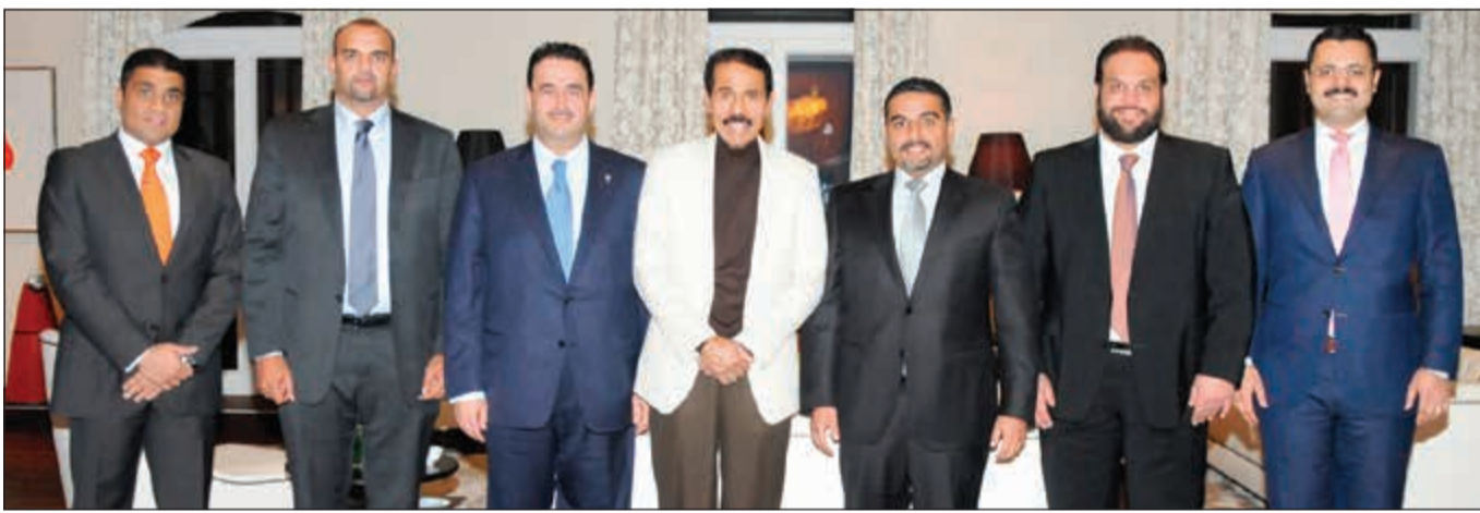
سمو ولي العهد الشيخ نواف الاحمد متوسطا السفير صادق معرفي وأعضاء سفارتنا في النمسا

الحرس الوطني الشيخ مشعل الاحمد مساء أمس الاثنين العاصمة النمساوية فيينا، متوجها إلى أرض الوطن بعد أن أمضى زيارة خاصة. وكان في وداع سموه على أرض المطار سفيرنا لدى جمهورية النمسا صادق محمد معرفي وأعضاء السفارة. وافقت سموه السلامة في الحل والترحال. وكان سمو ولي العهد والوكيلة الشيخ محمد العبدالله وكبار المسؤولين بالدولة. وكان سمو ولي العهد الشيخ نواف الاحمد غادر بحفظ الله ورعايته يرافقه نائب رئيس