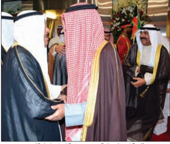
وسموه وصافح الشيخ فيصل السعود ويبدو الشيخ مشعل الاحمد

آخر الأخبار المحلية زوروا موقعنا على www.alanba.com.kw/Local