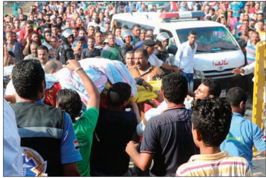
نقل جثامين المتوفين وسط تجمع مئات الأهالي ممن حاولوا تقديم المساعدة في الحادث المساسي