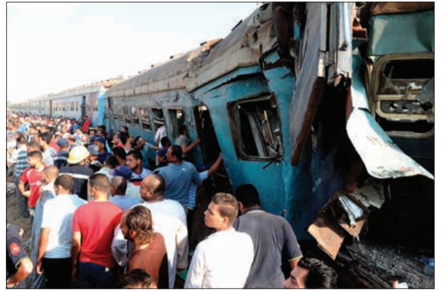
الأهالي أول من توجه لمساعدة المصابين وانتشال جثث المتوفين في الحادث

السياسي يوجه بمحاسبة المسؤولين عن الحادث.. والنائب العام يأمر بتشكيل لجنة هندسية لتحديد المسؤولية