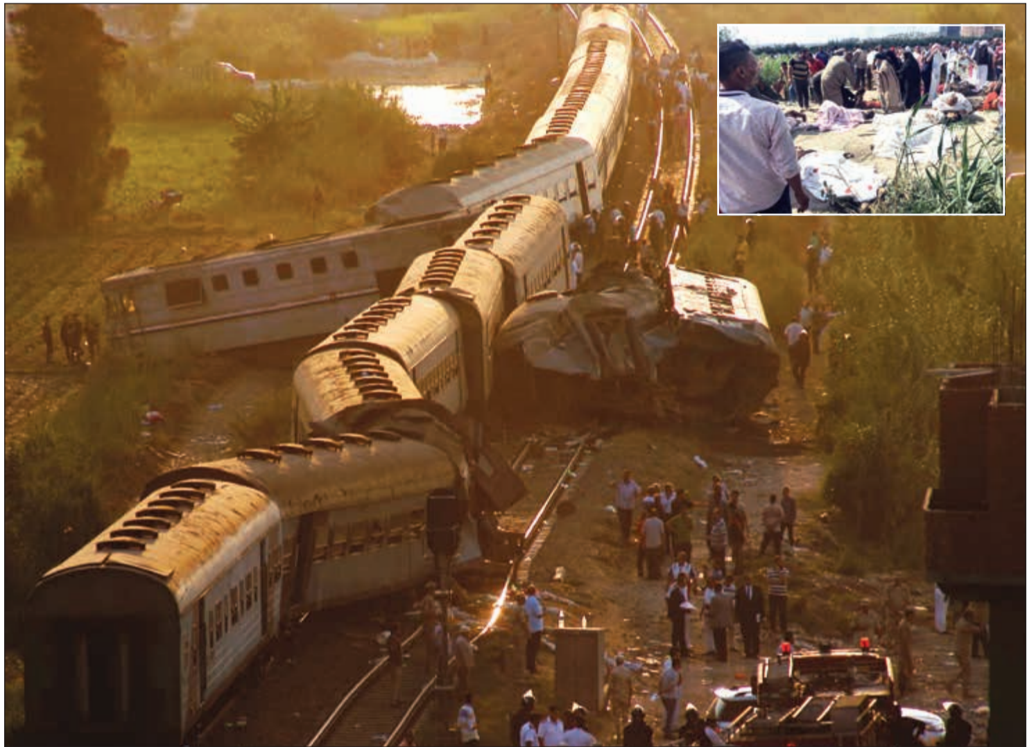
لقطة جوية تبين تصادم القطارين.. وفي الاطار مجموعة من الاهالي خلال مساعدة المصابين في الحادث