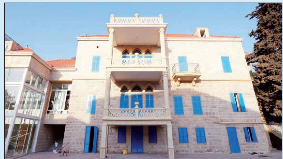
بيت الفنان في حمانا

الشريكة المؤسسة للبيت والمعروفة بإنتاجاتها الفنية التي جالت محلياً ودولياً، إلى إدامة التزامها ببناء ثقافة سلمية وتعزيز حرية التعبير. وسيستضيف «بيت الفنان» فنانين محليين ودوليين لتعميق بحثهم الفنية وتوسيع سكونهم المهنية وتعزيز ارتباطهم المجتمعي، علماً أنه يضم فضاءات للتدريب وإقامة الفنانين، وورشه سينوغرافيا