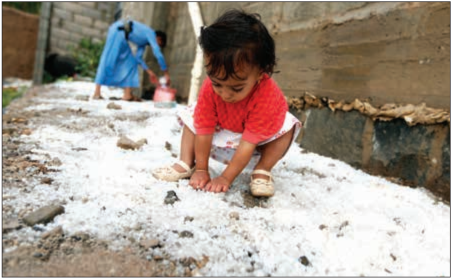
طفلة يمنية تلهو بالطحل الذي غطى احد شوارع صنعاء عقب مطر غزير أمس

بها ميليشيات الحوثيين». وربط المسؤول اليمني، ضمنيا، فتح المطار برفع الحوئين حصارهم عن مدينة تعز قائلا: «فك حصار تعز وإنهاء معاناة مئات الآلاف أولوية أساسية للحكومة اليمنية ولكل المنظمات الإنسانية ولا يجب إغفالها عند الحديث عن حلول».