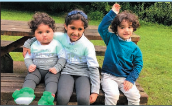
أطفال من الكويت يزورون البحيرة مع أهاليهم