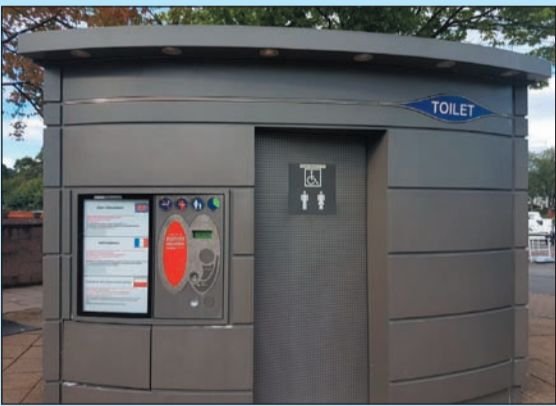
لماذا لاتكون عندنا مثل هذه الحمامات نظيفة وبغلووس؟