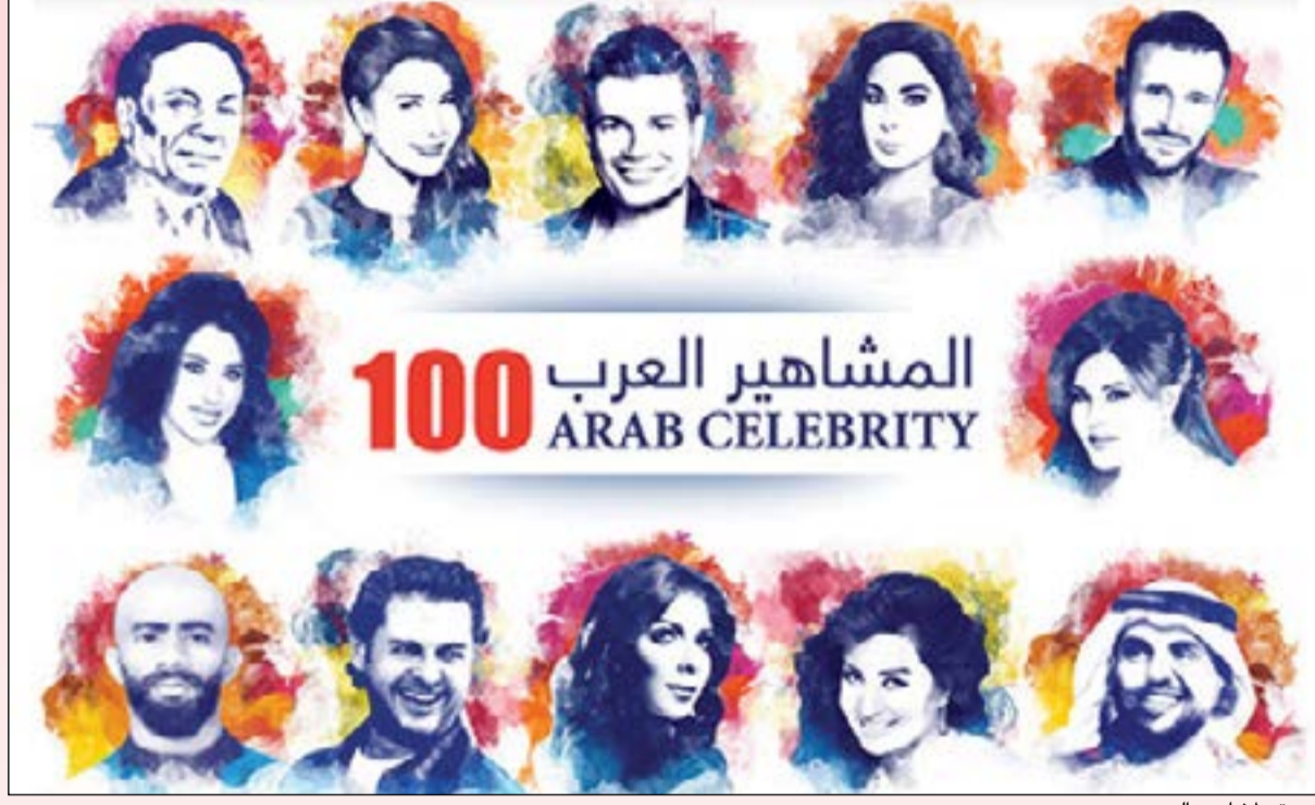
بوستر لمشاهير العرب