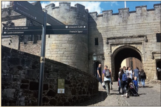
القلعة تستقطب الزائرين