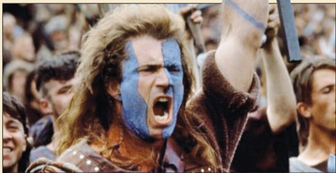
ميل غيبسون جسد دور والاس.. الاسطورة