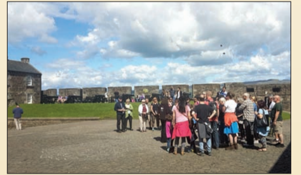
زوار وسائحون في ساحة القلعة