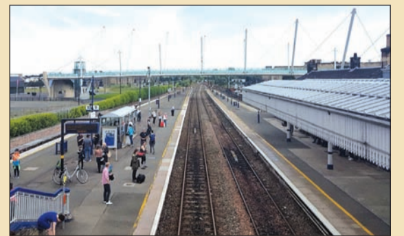
محطة القطار فسيحة ونظيفة وخضراء

من محطة القطار وصولا إلى القلعة ستشعر بالتعب اذا كنت ماشيا لأنك ستصعد الجبل الذي يضم القلعة التاريخية ومرافقها وقبورها وهذا الكم الهائل من المسطحات الخضراء الجميلة. تشعري تذاكر وتدخل القلعة وستجد قبلك مئات السياح قد سبقوك وهم يسابقون الزمن لرؤية محتويات القلعة التي تبهر «القبور» المحيطة بها لآلاف الإسكتلنديين الذين قتلهم الإنجليز في حرب التحرير حتى الاستقلال. في داخلها حفظ التاريخ مجسما كما هو بمطبخه وزناياته ومهاجع الجنود والمدافع والأدوات المستخدمة، وقد كتب تاريخ كل المراحل في جداريات، وهناك يعطونك جهازا يعرف بكل أقسام القلعة وتاريخها، سماعا ومشاهدة. وفي داخل القلعة هناك مقهى يقدم العصائر والمياه والاسناكس فقط وعندما تخرج ستجد محلا يبيع بكل تذكارات القلعة من سيوف ومدافع وملابس.. قلعة تاريخية تستحق المشاهدة.