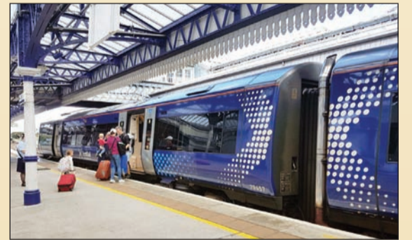
القطار الذي يوصلك من مانشستر إلى القلعة