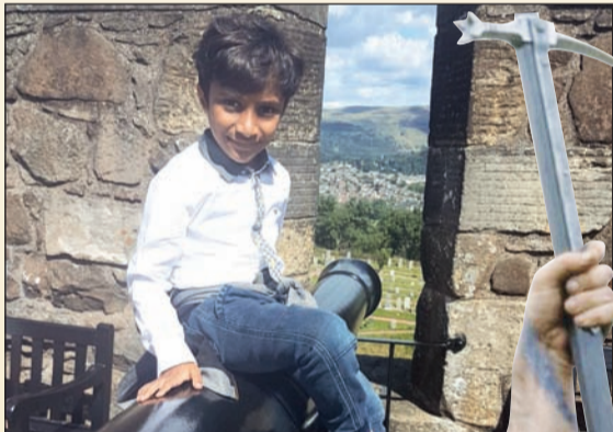
حفيد يوسف آتمنى ان يسير على دربي

بعد ان حرر السير وليام والاس بلاده من الإنجليز ونال انواط الشجاعة والألقاب، اعطاه بعض النبلاء والتجار دعما شجحا لا يلبق بفارس هزم الإنجليز في عز سطوتهم ومجدهم، وكان الملك ادوارد في حملة ضد فرنسا وقد رجع في مارس 1298، وفي 3 يوليو قام بغزو اسكتلندا وهزم والاس، ورغم فشل الملك ادوارد في اخماد الثورة قبل عودته كانت سمعة وليام والاس من (المخايرت والخونة) قد اطاحت بهذا الفارس التاريخي لاسكتلندا فاستقال من منصبه وحل محله البطل التاريخي رقيق دربه روبرت بروس، ومع وجود المتآمرين تتبع الإنجليز البطل وليام والاس وتمت مطاردته ورغم انه اختفى 4 سنوات دون ظهور إلا أنهم وصلوا له واعتقلوه وطلبوا منه ان يعترف بفرص بكبرياء وشهامة وبطولة، فعذب وأعدم حتى انهم انزلوه وهو يختنق من المشقة وطلبوا منه ان يعترف بفرص فقاموا بربطه بأربعة احصنة، اثنان للرجل ومثلها لليدين، ومزقوه ثم احرقوا اعضاءه ثم تم تجميعه وتعليقه على جسر لندن وتوزيع اطرافه على نيوكاسل وبروك وسترلينج وابردين حتى يكون عبرة... فتحول الى بطل اسكتلندي حقيقي وقلب شجاع.