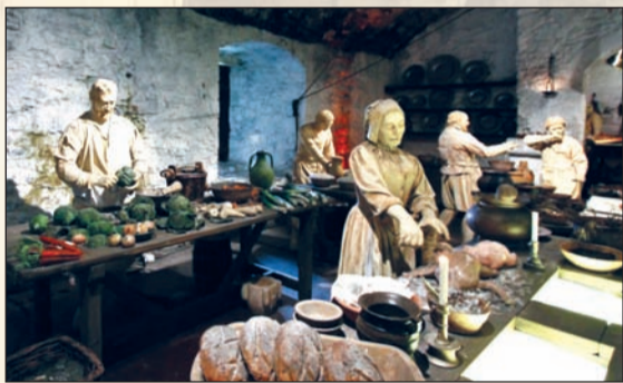
مجسمات لمطبخ القلعة

باوند والأكل 150 باوند، اما المواصلات فيعطي الطالب كرتا كلفته شهريا 5 باوند.