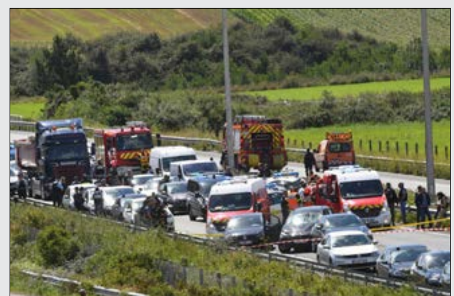
الشرطة الفرنسية تحاصر سيارة منفذ عملية دهس الجنود قبيل اعتقاله أمس

هجوم على جنود من عملية «سانتينيال» أمام برج إيفل في باريس. ووقعت العملية قرب مكتبة