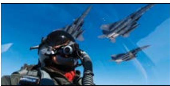
طيار أميركي خلال مهمة فوق جزيرة «غوام» في 30 يوليو الماضي

أن هذه الخطة قد يتم تنفيذها «في أي لحظة، فور اتخاذ كيم جونج أون القائد الأعلى قراراً بذلك». إلا أن وزير الخارجية الأميركي ريك تيلرسون وفي خطوة استباقية، توجه إلى جزيرة غوام نفسها، وقال أنه لا يرى أي تهديد عسكري، مشيراً في الوقت ذاته إلى أن تصريحات ترامب لا تعني حتماً استخدام القوة. من جهته، انتقد السيناتور الجمهوري جون ماكين تصريحات ترامب قائلاً: إن على الرئيس أن يكون على أهبة الاستعداد لتنفيذ تهديداته.