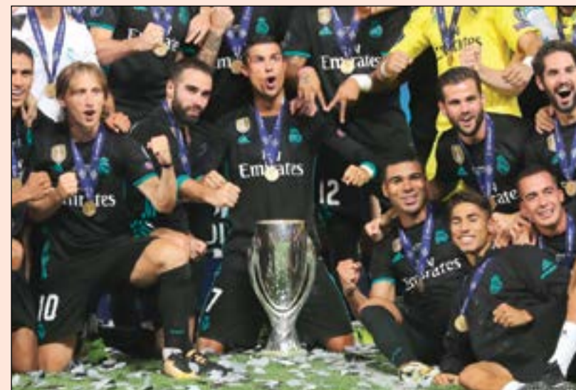
لاعبو ريال مدريد يحتفلون بالحصول على الكأس السوبر الأوروبية

يبدو أن ريال مدريد الإسباني ومدربه الفرنسي زين الدين زيدان لا يعرفان إلا معانقة الذهب، فبعد التتويج بلقبين «الليغا» ودوري الأبطال في الموسم الماضي، أضاف «الملك» لقباً جديداً إلى خزائنه بحصوله على لقب الكأس السوبر الأوروبية بغوزه على بطل «يوروبا ليغ» مان يونبايتد الإنجليزي 12 في العاصمة المقدونية سكوبيي. وقال «زيزو» عقب التتويج: «لقد قمنا بعمل مذهل، ونحن سعداء للغاية لبداية الموسم بهذه الطريقة».