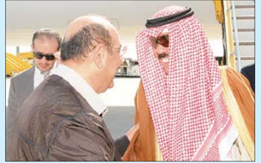
سمو ولي العهد الشيخ نواف الأحمد لدى وصوله إلى التمسا وفي مقدمة مستقبليه الشيخ مشعل الأحمد