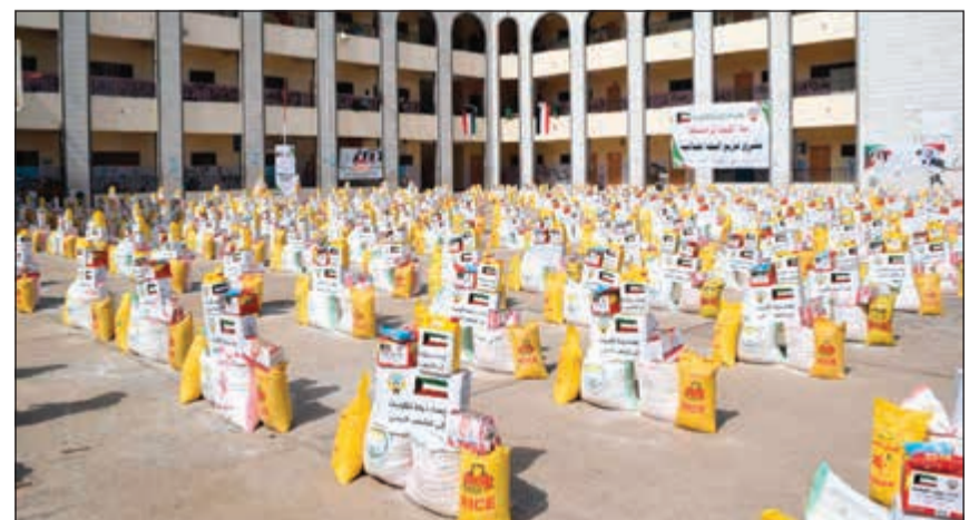
جانب من المساعدات الكويتية