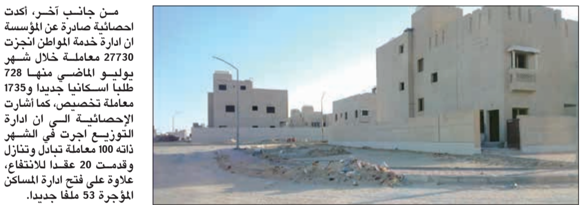
جانب من مشروع غرب عبدالله المبارك

من جانب آخر، أكدت احصائية صادرة عن المؤسسة ان ادارة خدمة المواطن انجزت 27730 معاملة خلال شهر يوليو الماضي منها 728 طلبا اسكانيا جديدا و1735 معاملة تخصيص، كما اشارت الاحصائية الى ان ادارة التوزيع اجرت في الشهر ذاته 100 معاملة تبادل وتنازل وقدمت 20 عقدا للاتفاق، علاوة على فتح ادارة المساكن المؤجرة 53 ملفا جديدا. وبينت الاحصائية ان قسم الاستقبال استقبل 7500 استفسار وقدم 482 شهادة لمن يهيمه الأمر موجهة إلى بنك الأئتمان الكويتي واستقبل 1436 معاملة بدل إيجار في حين قدم قسم المتابعة 188 كتابا لتقسيم الميونيات على المواطنين ورد على 282 حالة استفسار بهذا الشأن.