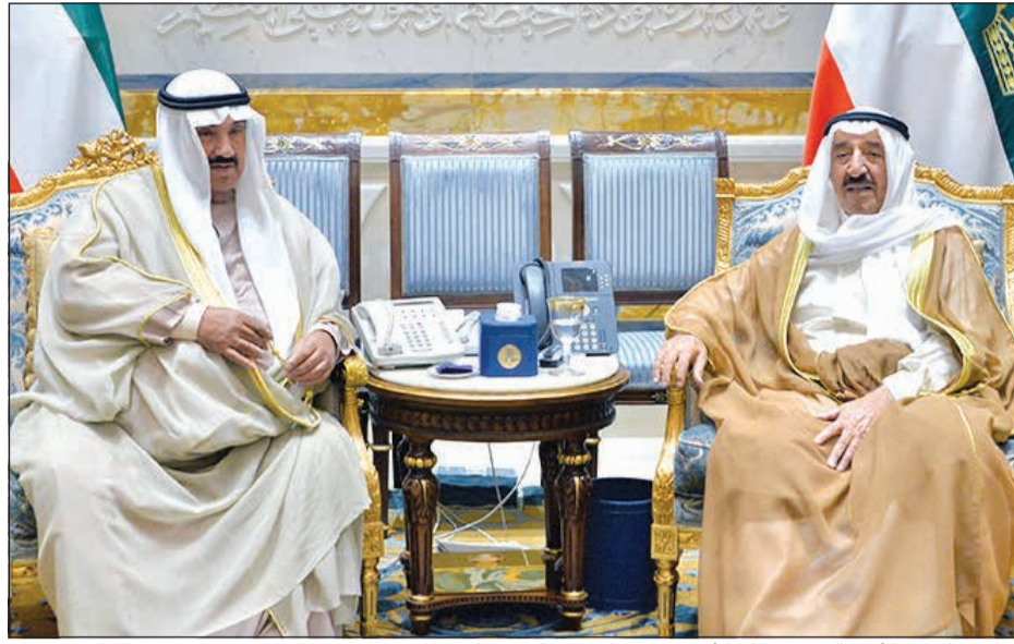
صاحب السمو الأمير الشيخ صباح الأحمد مستقبلاً سمو الشيخ ناصر المحمد

استقبل صاحب السمو الأمير الشيخ صباح الأحمد بقصر بيان صباح أمس سمو الشيخ ناصر المحمد. إلى ذلك، بعث صاحب السمو الأمير الشيخ صباح الأحمد ببرقية تعزية إلى أخيه خادم الحرمين الشريفين الملك سلمان بن عبدالعزيز آل سعود ملك المملكة العربية السعودية الشقيقة عبر فيها سموه عن خالص تعازيه وصادق مواساته بوفاة المغفور له بإذن الله تعالى سمو الأمير سلمان بن سعد بن عبد الله بن تركي آل سعود، سائلاً سموه المولى تعالى أن يتغمده بواسع رحمته ويسكنه فسيح جناته وأن يلهم الأسرة المالكة الكريمة جميل الصبر وحسن العزاء. وبعث سمو ولي العهد الشيخ نواف الأحمد ببرقية تعزية إلى أخيه خادم الحرمين الشريفين الملك سلمان بن عبدالعزيز آل سعود ملك المملكة العربية السعودية الشقيقة ضمنها سموه خالص تعازيه وصادق مواساته بوفاة المغفور له بإذن الله تعالى سمو الأمير سلمان بن سعد بن عبد الله بن تركي آل سعود، سائلاً سموه المولى تعالى أن يتغمده بواسع رحمته. كما بعث سمو رئيس مجلس الوزراء الشيخ جابر المبارك ببرقية تعزية مماثلة.