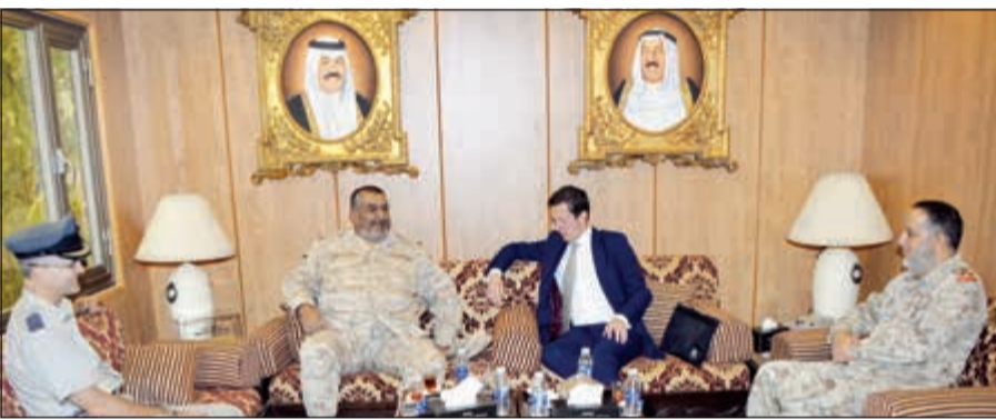
اللواء الركن الشيخ خالد الصالح الصباح مستقبلاً رئيس السياسة الدولية والخطط في وزارة الدفاع البريطانية ديفيد هوجان ميرين

استقبل أمر القوة البرية اللواء الركن الشيخ خالد الصالح الصباح بمكتبه صباح أمس رئيس السياسة الدولية والخطط في وزارة الدفاع البريطانية ديفيد هوجان ميرين والوفد المرافق له بمناسبة زيارته للبلاد، حيث تم خلال اللقاء تبادل الأحاديث الودية ضمن محور الزيارة ومناقشة أهم الأمور والمواضيع ذات الاهتمام المشترك لإسبما المتعلقة بالجوانب العسكرية وسبل تطويرها وتعزيزها. حضر اللقاء مدير عمليات القوة البرية العميد الركن عبدالله علي الجبعة والملحق العسكري البريطاني العقيد طيار فينلي ماكلين.