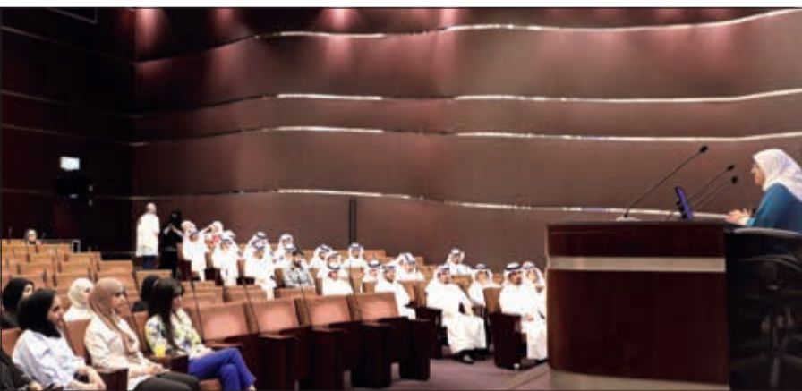
جانب من اللقاء التدريبي

جانب التعريف بالعلاقات الدولية والإقليمية والعربية، ونظام ولوائح التقييم والدوام والرواتب والترقيات، إضافة إلى دليل العمليات الرئيسية ودليل أخلاقيات المهنة، وأدلة العمل في قطاع الشؤون الإدارية والمالية. أما فيما يتعلق بالبرامج الموجهة إلى فئة القائمين، أضفت الأحمد أنه سيتم التعرف خلالها على قانون انشاء الهيئة العامة لمكافحة الفساد، وقانون انشاء دائرة المحكمة الكلية لنظر المنازعات الإدارية، وشرح أحكام الخدمة المدنية والقرارات والتعاميم المعملة لها، مشيرة إلى أن البرامج سلطت الضوء على المخالفات المالية، والجوانب القانونية لحاضر الاجتماع والتقارير، وإعداد وصياغة اللوائح والقرارات الإدارية. وأفادت بان المرحلة الثالثة لتدوير المدربين بين قطاعات الديوان بهدف تعريفهم بطبيعة عمل القطاعات والإدارات التابعة لها، أما المرحلة الرابعة فيتم من خلالها تدريب المعينين الجدد في الكويت للدراسات القضائية والقانونية، وصولاً إلى المرحلة الخامسة وهي تدريب الموظف على رأس العمل داخل القطاع المنتمي إليه لتزويده بكافة الأعمال والإجراءات والمهارات العملية والتطبيقية.