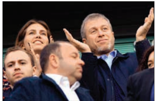
مالك تشيلسي وزوجته السابقة

موسكو - أ.ف.ب: أعلن الملياردير الروسي رومان ابراموفيتش صاحب نادي تشيلسي الإنجليزي لكرة القدم انفصاله عن شريكة حياته داريا جوكوفا بعد علاقة استمرت عشر سنوات، ولم يؤكد ابراموفيتش (50 عاماً) الذي كان في فترة من الفترات اثرياً روسياً، إذا كان قد تزوج من جوكوفا التي استت صالة العرض الفنية «غاراج» في موسكو، كما ذكرت بعض وسائل الإعلام. ولم يوضح البيان الصادر عنهما الاثنان هذا الأمر.