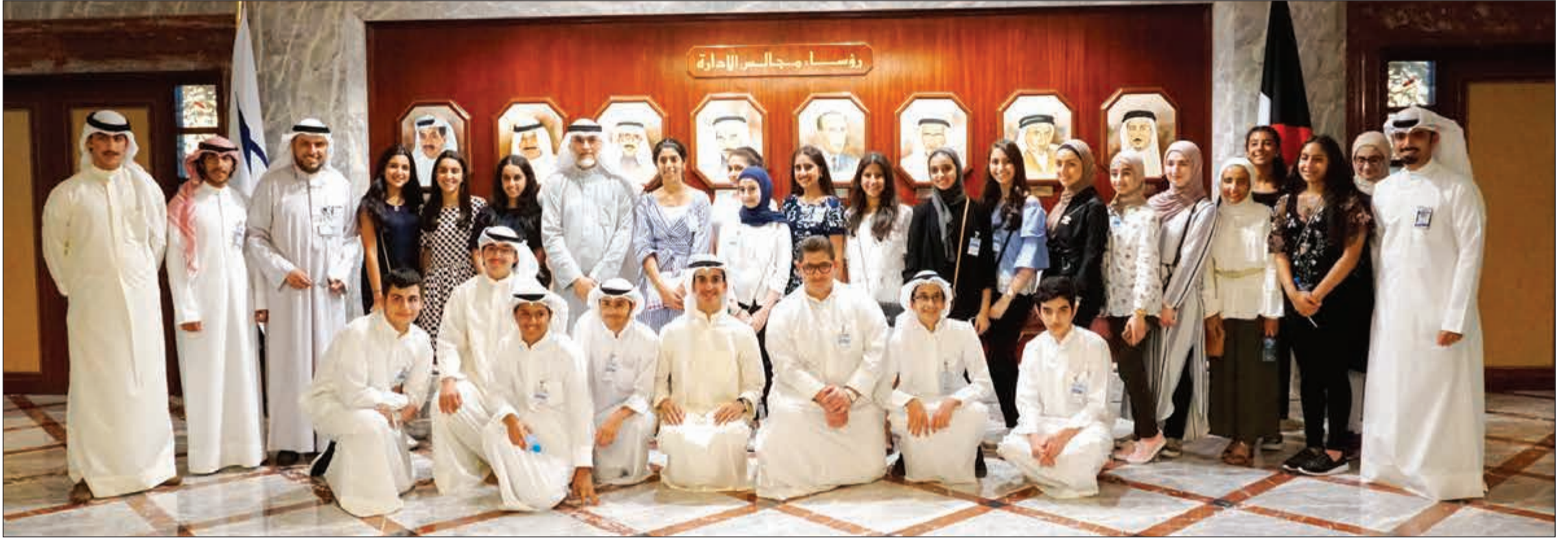
المشاركون في البرنامج التدريبي الصيفي