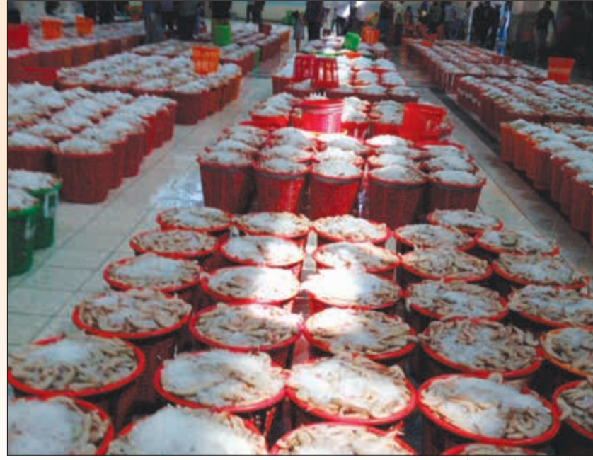
فرصة لمحبي تناول الربيان

2,5 دينار للوسط و3,5 للكبير و1250 سلة دخلت ساحة المزاد