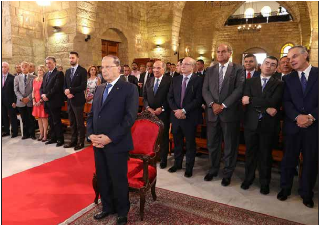
الرئيس العماد ميشال عون خلال مشاركته في قداس كنيسة سيدة التلة في دير القمر في الذكرى السادسة عشرة للمصالحة التاريخية في الجبل (محمود الطويل)

وعليه يعتبر بيضون أن نفي السيد نصرالله لملصوع حزب الله بـ «خلية العبدلي»، هو لرفع الحرج عن رئيس الجمهورية العماد