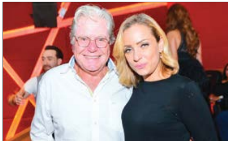
ريم البارودي وحسين فهمي