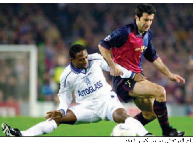
راح البرتغالي بسبب كسر العقد

بعد إعلان انتقال النجم البرازيلي نيمار من فريقه برشلونة إلى باريس سان جرمان، خسرت البارسا نجمه الكبير في نهاية غير متوقعة لعلاقة كان من المرجح أن تستمر طويلاً، أو هكذا كان يأمل البلوغرانا وجماهيره، لكن تأتي الرياح بما تستهني السفن الكاتالونية. وبالرغم من الانتقادات الحادة التي يطلقها عشاق البارسا ضد نيمار واتهامه بأنه يلهث خلف الأموال، وهو أمر ربما يصيب كثيراً من الحقيقة، لكن الحقيقة الأليمة التي يجب على هذا الجمهور إدراكها جيداً، أن إدارة ناديه هي من تسببت في هذا الموقف السيئ للفريق. والغريب أن التاريخ يثبت أن استهتار إدارة برشلونة في الحفاظ على النجوم، ووضع شرطاً جزائياً في المتناول، كلفهم خسارة العديد من الأسماء اللمعة وكان رحيلهم عن الفريق بمنزلة طعنات. وفي هذا الموضوع سنذكر رموز كروية غادرت الكامب نو عن طريق دفع مبلغ الشرط الجزائي في عقودهم. – كانت البداية ربماً مع واحد من أساطير كرة القدم، وهو رونالدو «الظاهرة» اللاعب الذي جلبه برشلونة