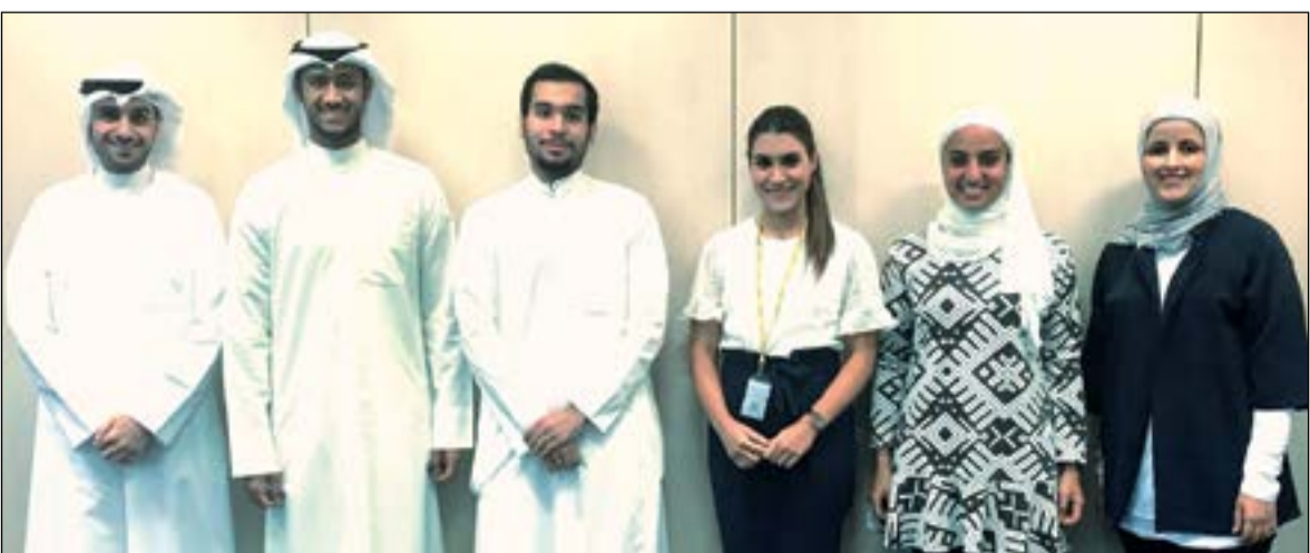
فريق البنك الأهلي مع بعض المتدربين

الأهلي الكويتي من الداعمين الرئيسيين للقطاع التعليمي في الكويت، من خلال شراكته مع الهيئات التعليمية والتدريبية المختلفة، في سبيل اكتساب الطلبة خبرة العمل الفعلية استعداداً لمرحلة ما بعد التخرج.