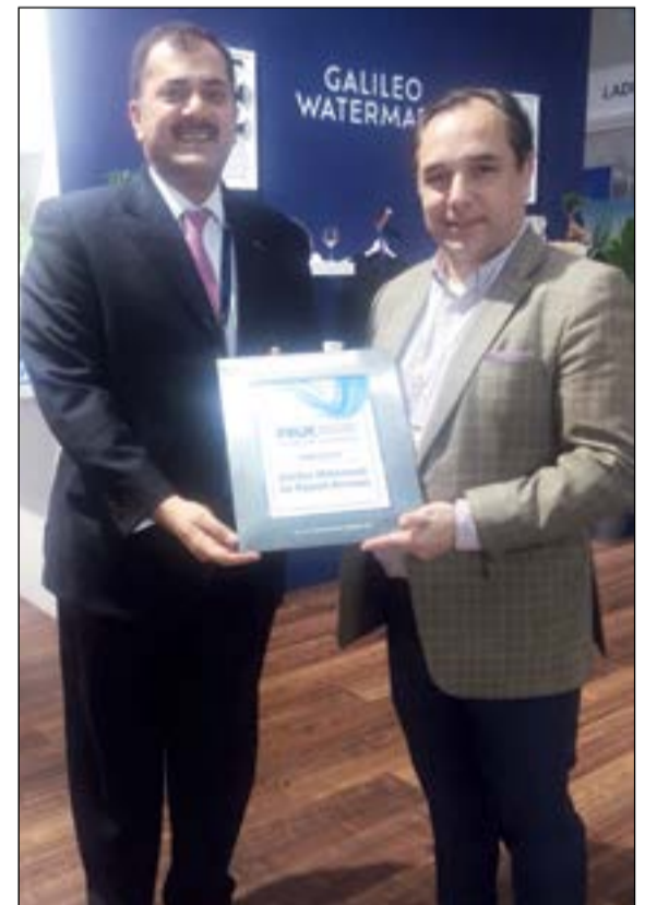
ممثل «الكويتية» يتسلم الجائزة