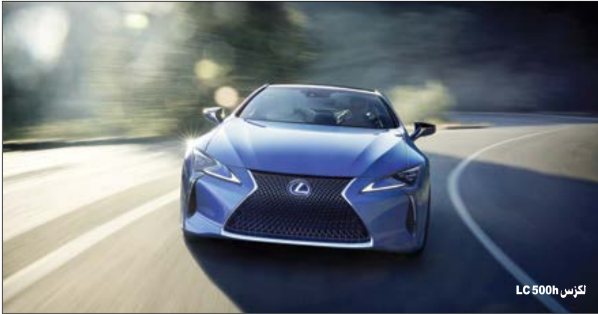
لكزس LC 500h

لتقديم المشاركات الخاصة بمهرجانات السينما وصناعة الأفلام. وقال تاكاوكي يوشيتسوغو الممثل الرئيسي للمكتب التمثيلي لشركة تويوتا في الشرق الأوسط وشمال أفريقيا: ساعدت مبادرة «لكزس» للأفلام القصيرة منذ بدايتها على دعم المسيرة المهنية لصناعة الأفلام الناشئين والطموحين من شتى أنحاء العالم، وذلك من خلال تزويدهم بالأدوات اللازمة للارتقاء بحرفتهم إلى مستويات متقدمة. ويبقى هدفنا الأسمى في لكزس ابتكار تجارب من شأنها تشجيع مصدر إلهام للناس، كما نسعى من خلال مثل هذه المبادرات إلى إيصال شغفنا بالتصميم والابتكار إلى شريحة أكبر من الجماهير في جميع أنحاء العالم، وإحداث تأثير إيجابي على حياتهم، ونحن نقدر بصدق الدعم المستمر الذي نلقاه من عملائنا، والذي يشكل مصدر إلهام لنا لابتكار مشاريع تلامس الحواس.