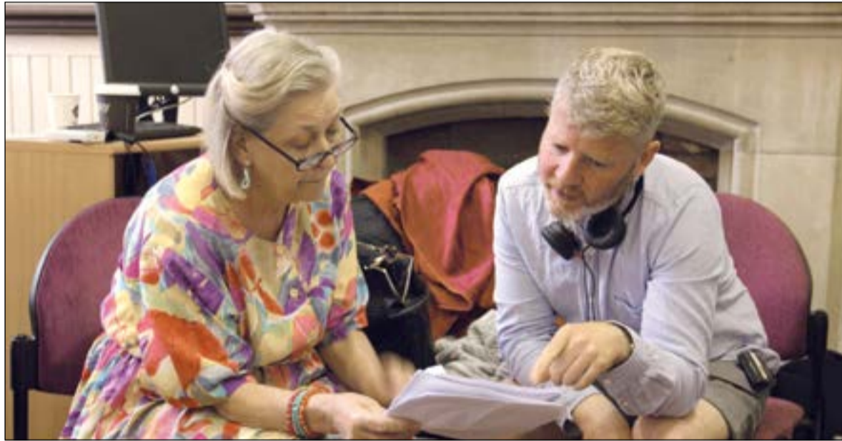
Nations Holds its Breath من كواليس تصوير الفيلم القصير

ويدير موضوع هذا الموسم من مبادرة «لكزس» للأفلام القصيرة، «حول التحول»، الذي ينبع من صميم القناعة الراسخة لعلامة لكزس بأن الأشياء المدهشة تحدث عندما يتم تحويل الأمور العادية