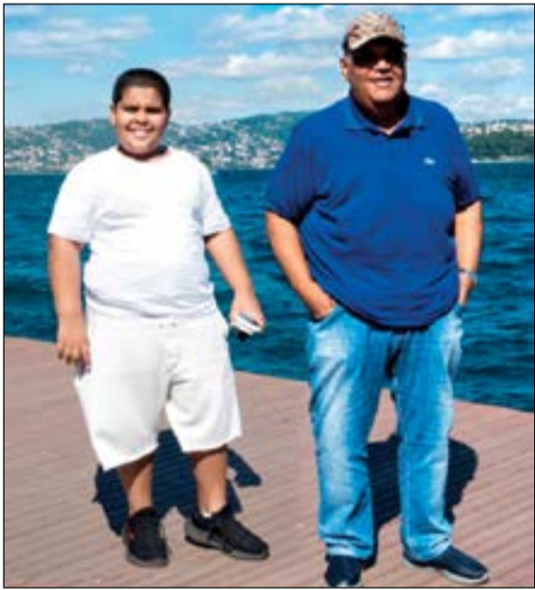
بوشعيل مع ابنة عبدالوهاب في تركيا

بتواجد «لبيل الخليج» الفنان القدير نبيل شعيل في تركيا للراحة والاستجمام، بعد خضوعه لعملية جراحية قبل شهرين، بسبب معاناته لفترة طويلة من آلام الظهر والركبة. وبدأ بوشعيل بصحة جيدة بعد خضوعه لفترة علاج فيزيائي، حيث نشر عبر صفحته الخاصة على «انستغرام» صورة من إجازته تجمعها وابنه، وعلق: «مع السبع عبدالوهاب الشعيل». يذكر أن شركة روتانا كانت قد طرحت في ديسمبر الماضي ميني اليوم لنيل شعيل، بعنوان «نيل شعيل 2017»، وضم الألبوم 4 أغنيات وهي «أبجد هوز»، و«كله تمام»، و«إنسانة تقدر»، و«الناس غير الناس».