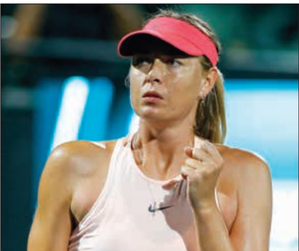
عودة رابطة الروسية للحسناء

تاهلت الروسية ماريا شاربوقا إلى الدور الثاني في بطولة ستانفورد للنتس للسيدات. ففي الدور الأول للبطولة المقامة في ولاية كاليفورنيا الأميركية فازت شاربوقا على الأميركية جنيفر برايد بمجموعتين مقابل واحدة وبواقع 6-4 و6-0. وصعدت الكرواتية آنا كونيود المصنفة الخامسة إلى الدور الثاني بعد انسحاب منافستها مارينا إيراكوفيتش لاعبة نيوزيلندا التي كانت متأخرة بنتيجة 3-6 و0-5. وتوقفت الأميركية كابلداي على اليابانية ميساكي دوي 4-6 و2-6. وصعدت الأوكرانية ليسيا تسورينكو المصنفة السابعة إلى الدور الثاني بعد تغلبها على الإسبانية لارا أروبارينا فيسينو بواقع 6-3 و6-3. وقالت شاربوقا في مقابلة على جانب الملعب «أشعر وكناني أريد معانقة الجميع وأقول لهم شكرا. إنها مباراتي الأولى في الولايات المتحدة منذ فترة طويلة حقا». وتعرضت شاربوقا لضغط من جانب برادي التي أجبرتها على خوض عدة أشواط طويلة خلال المباراة.