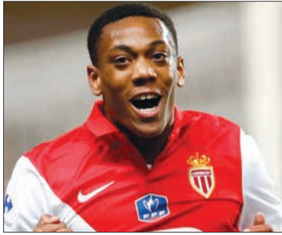
مارسيل ترس الخزينة

ضربة أخرى حققها موناكو بتعاقدته مع كاراسكو سنة 2010 مجاننا قادما من غينك قبل أن يبيعه سنة 2015 لآنتليكو مدريد مقابل 17 مليون يورو. ولا ننسى ابن الأكاديمية الظهير الأيسر كورزوا الذي رحل سنة 2015 نحو باريس سان جرمان مقابل 25 مليون يورو. وجنى موناكو أموالا طائلة من خاميس رودريغيز الذي