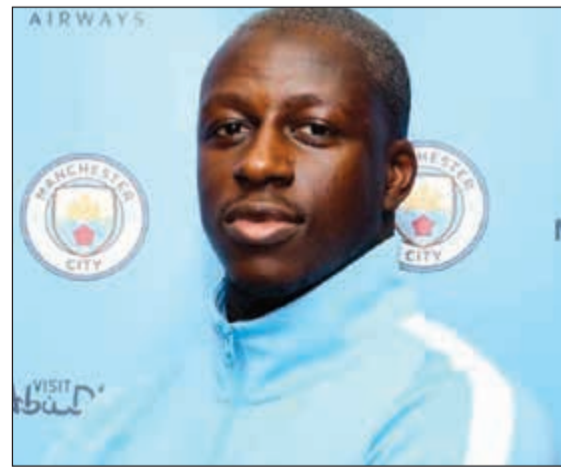
ميندي بقميص مانشستر سيتي