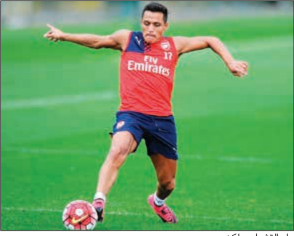
عاد التشيلي ولكن

ارتبط اسم النجم التشيلي اليكسيس سانتشيز بالرحيل عن فريق أرسنال خلال فترة الانتقالات الصيفية الحالية. واهتم كل من باريس سان جرمان وبايرن ميونخ وفريق مان سيتي بالتعاقد مع اللاعب الذي تأخر عن تدريبات فريقه ولكنه عاد أخيرا بعد غياب، لاسيما أنه رفض تجديد عقده وطلب من إدارة الفائز الرحيل. وتكثفت صحيفه الإسبريس الإنجليزية أن هناك 10 لاعبين لم يحددوا مصيرهم مع المدفعية سواء بتجديد العقد أو بالرحيل. وأكدت الصحيفة أن اللاعبين العشرة قد برحلوا عن النادي اللندني في الفترة المقبلة وهم اليكسيس سانتشيز ومسعود أوزيل واليكس تشامبرلين وجاك ويلشير وسانتي كازورلا وكيران غيبس وجويل كامبل وكارل جينكسون والحارس مات ماكي إلى جانب المدافع بير ميرتيساكر.