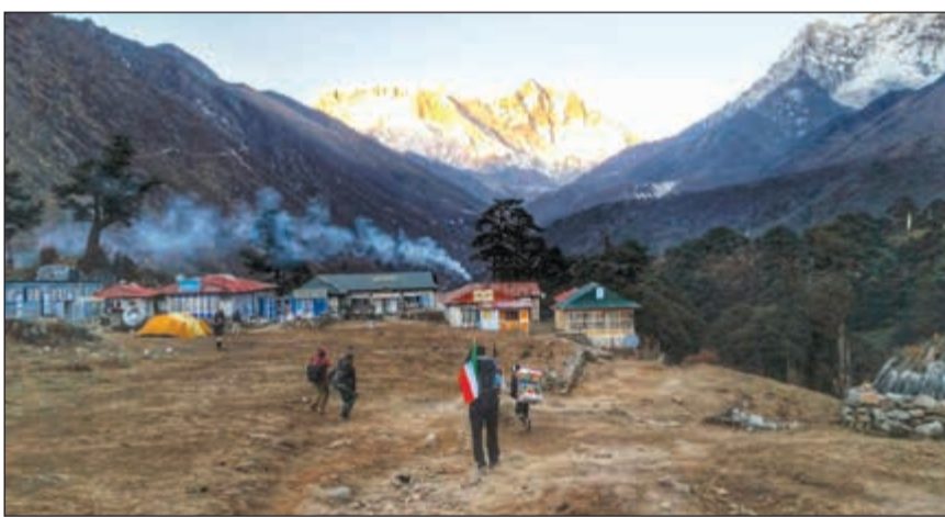
المخيم الذي سكن فيه المستكشفون

نورث فيس، وباتاغونيا، وأركتريكس، وهوديني. وهذه المجموعة الشبابية تابعة لشركة «رحالة»، الشركة المتخصصة بتخطيط وتنفيذ رحلات السفر استكشافية بعيدة ومغامرات شاقة، والتي وقعت معها شركة علي عبد الوهاب المطوع التجارية مؤخرًا عقد شراكة لتقديم الدعم والتشجيع للمغامرات والأنشطة التي تنظمها.