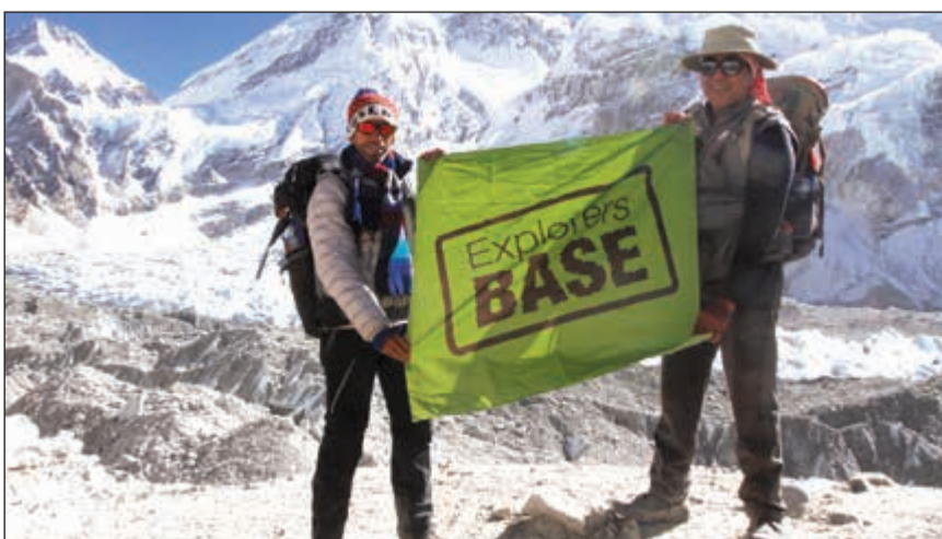
الرحلة يرفعون علم «إكسبلوريز بيس» على قمة جبل «إفرست»

تقديم أفضل المعدات أداء وأحسن نوعية الملابس. وتقدم منتجات خاصة بهذه الرحلة الاستكشافية الشاقة والملينة بالتحديات والمخاطر التي تتطلب تجهيزات وملابس وقائية وضرورية لاستكمالها بنجاح وأمان. وقد ساعدت التجهيزات التي قدمتها شركة علي عبد الوهاب المطوع التجارية لهؤلاء الرحالة من بناطيل وسترات صوفية وملابس قطنية داخلية على جعلهم يشعرون بالراحة والدفاء في ظل درجات الحرارة المنخفضة، وحمايتهم من أي مؤثرات جوية، دون أن تقيد الحركة خاصة في هذه الرحلة الجبلية التي تتطلب مجهودا كبيرا وتمنحهم الإحساس بالانتعاش والتهوية